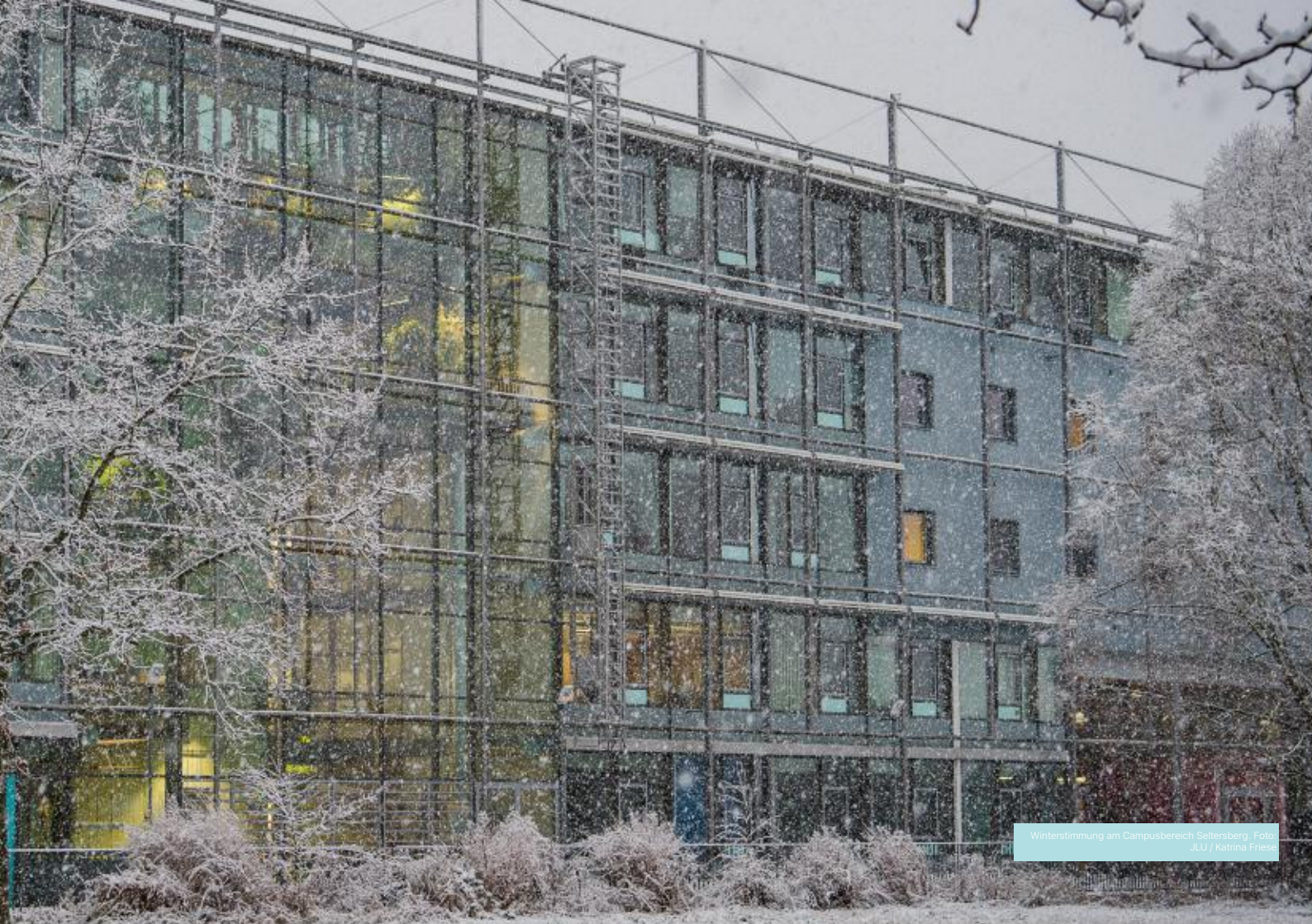
Winterstimmung am Campusbereich Seltersberg.