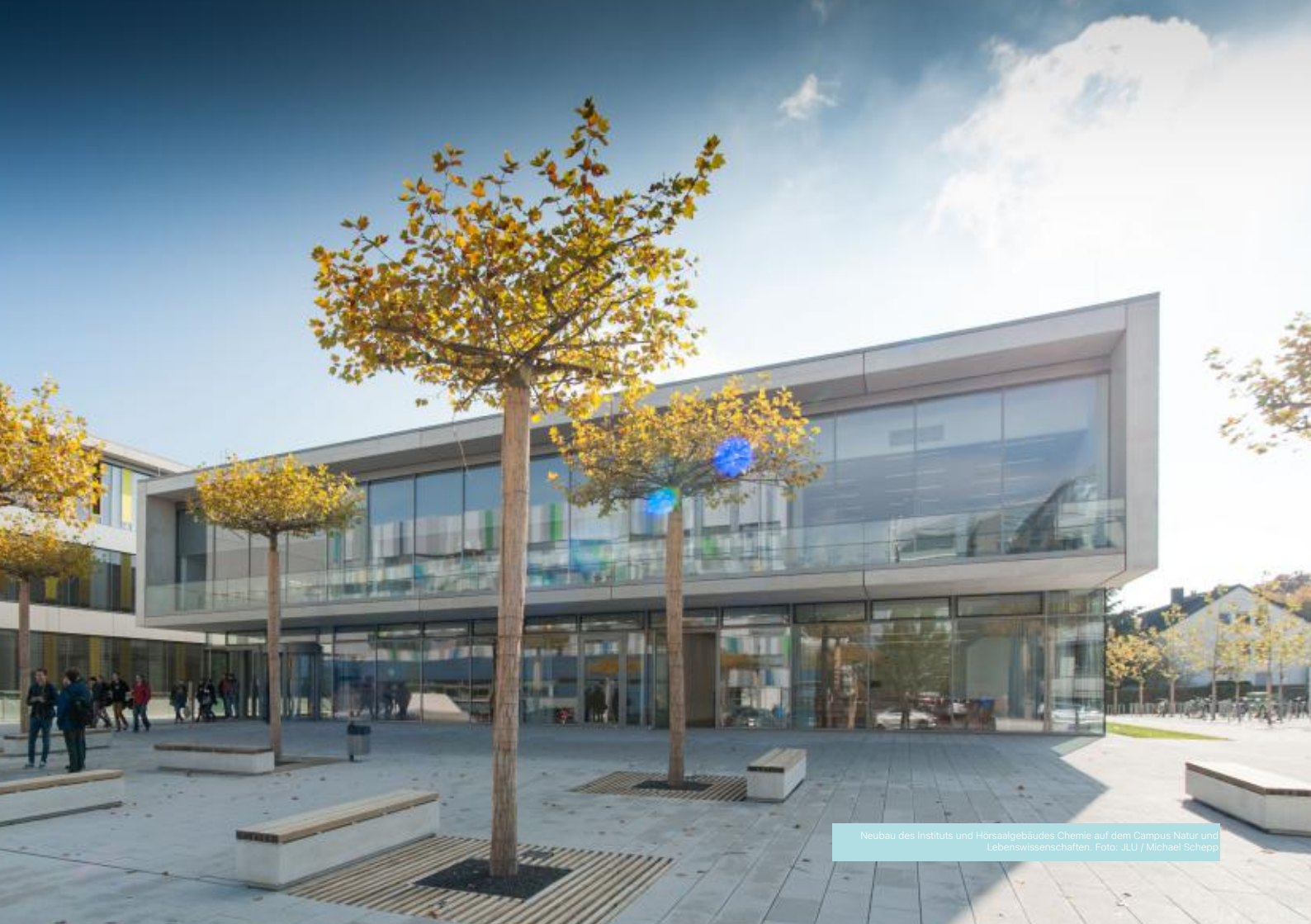
Neubau des Instituts und Hörsaalgebäudes Chemie auf dem Campus Natur und Lebenswissenschaften.