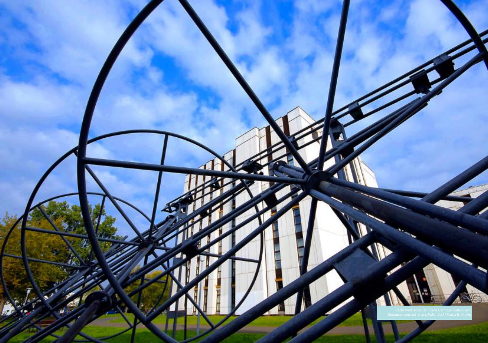
Räderwerk Nord auf dem Campus Kultur- und Geisteswissenschaften.