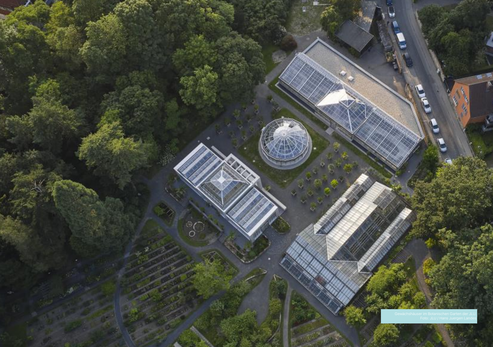
Gewächshäuser im Botanischen Garten der JYU.