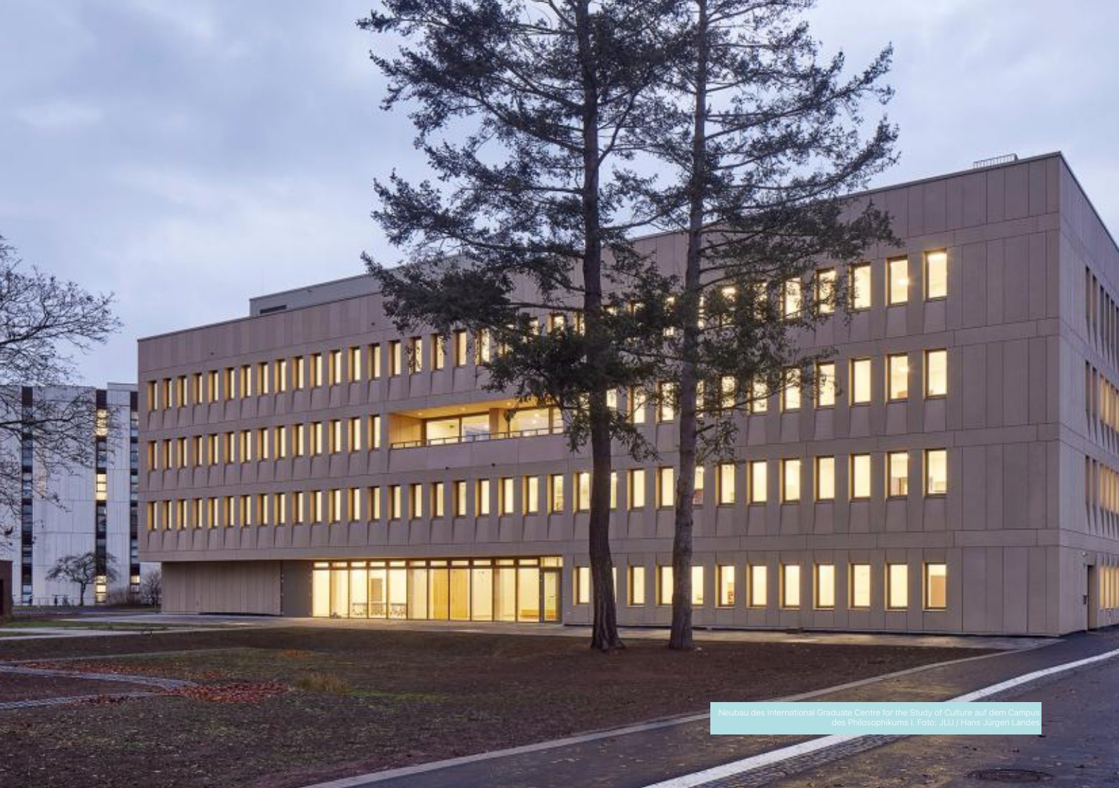
Neubau des International Graduate Centre for the Study of Culture auf dem Campus des Philosophikums I.