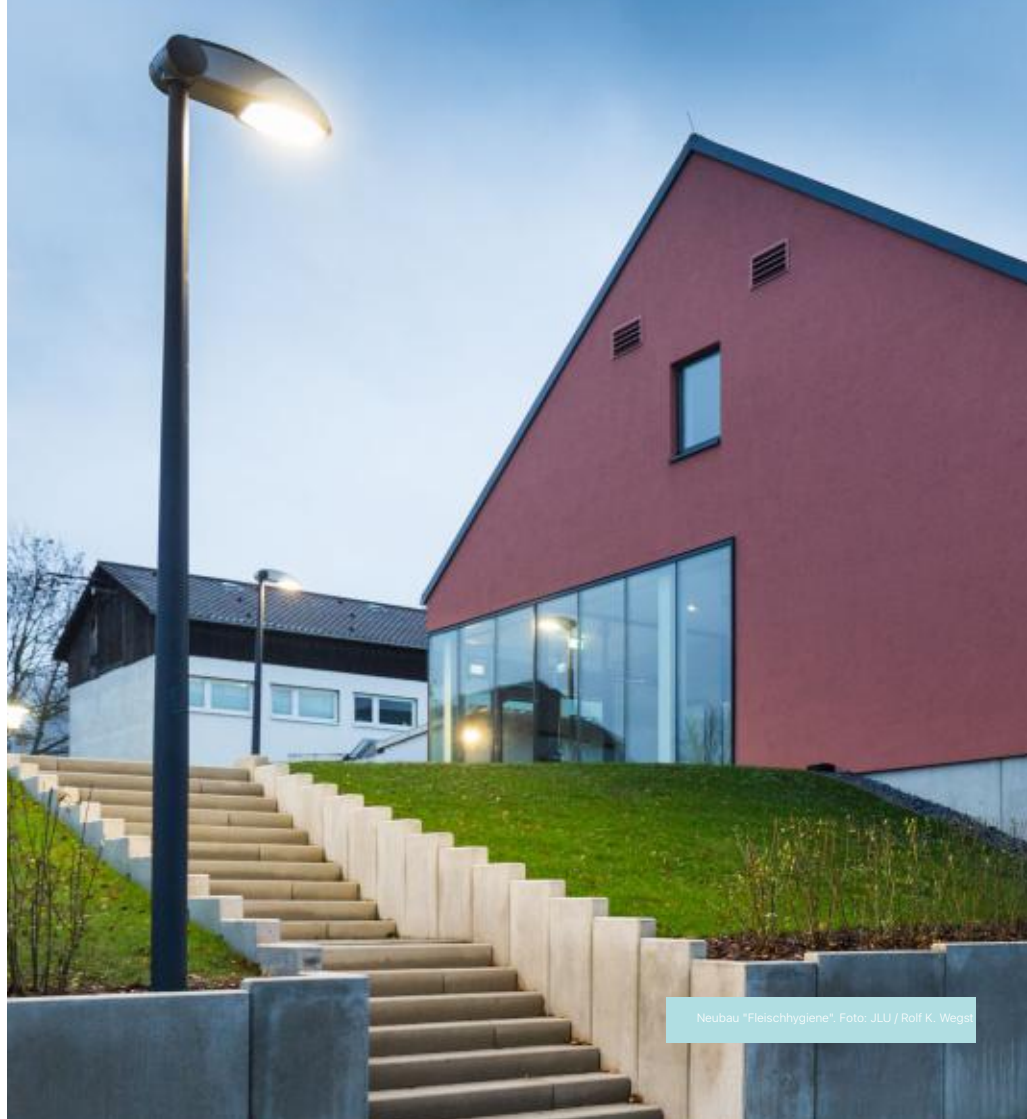
Neubau "Fleischhygiene".

Ort Treffpunkt: Am Eingang der Zweigbibliothek Philosophikum II