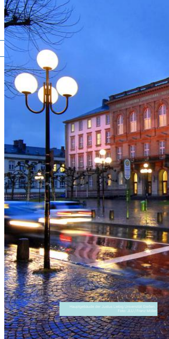
Hauptgebäude der Justus Liebig Universität Gießen.

Sie erreichen uns unter der Telefonnummer +49 (0) 641 / 99 12353 oder per E-Mail an anmeldung.personalentwicklung@unigiessen.de .