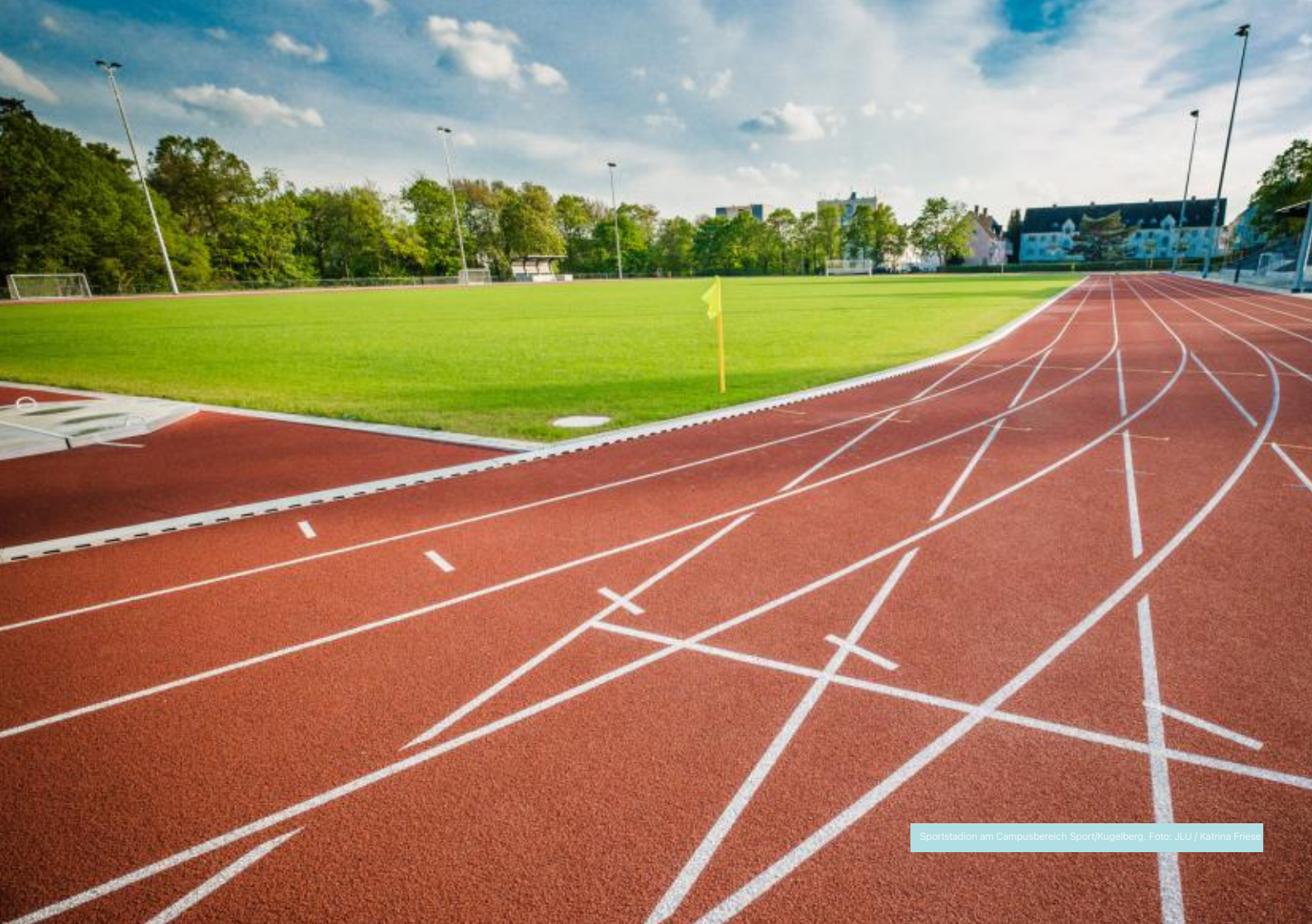
Sportstadion am Campusbereich Sport/Kugelberg.