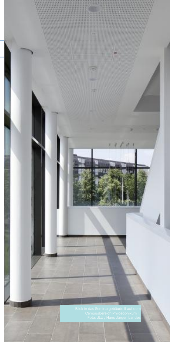
Blick in das Seminargebäude II auf dem Campusbereich Philosophikum I.

Weitere Informationen finden Sie unter www.unigiessen.de/pe/zfh .