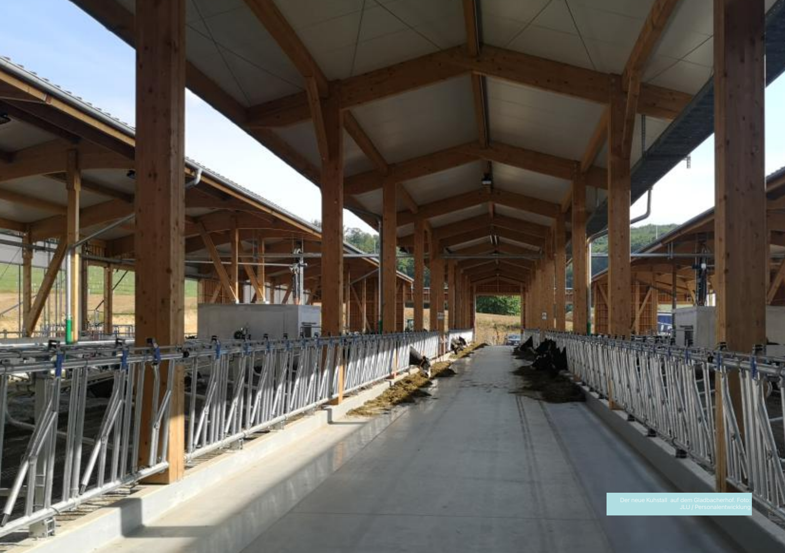
Der neue Kuhstall auf dem Gladbacherhof.