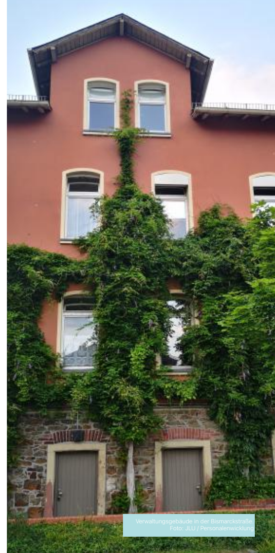
Verwaltungsgebäude in der Bismarckstraße