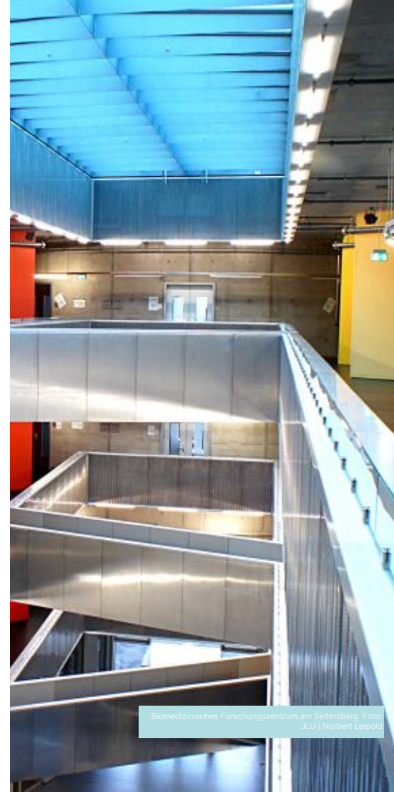
Biomedizinisches Forschungszentrum am Sellberg.

Ort Online-Veranstaltung: Teilnahme über PC