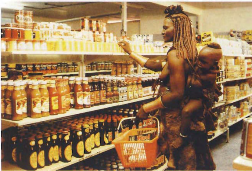
Fig. 11 Im Supermarkt von Opuwo, dem Verwaltungssitz am Südostrand des Kaokolandes, treffen zwei Welten aufeinander. Hier endet die befestigte Straße, und hier beginnt der traditionelle Lebensraum der Himba. Opuwo bedeutet etwa so viel wie „genug“ oder „nicht weiter“ und umschreibt eindrücklich die Himba-Einstellung über das Vordringen moderner Siedlungen auf Himba-Land. Separate worlds meet at Opuwo at the southeastern fringe of Kaokoland. Here the metalled road ends and the traditional Himba heartland begins. The meaning of “Opuwo” in Himba language is “enough” or “no step further”, clearly indicating their perception of how far modern settlements should reach.

der bodenvagen Lebensweise der halbnomadischen Himba. Hier sind die wichtigsten Ahnherren begraben, hier werden die Schädel der Ochsen der obersten Rinderkategorie aufbewahrt, und zu diesen Plätzen kehrt man anlässlich neuer Trauerfeierlichkeiten immer wieder zurück (BOLLIG 1997, JACOBSON 1988). Eine Unterbrechung dieser Tradition würde die aus emischer Sicht