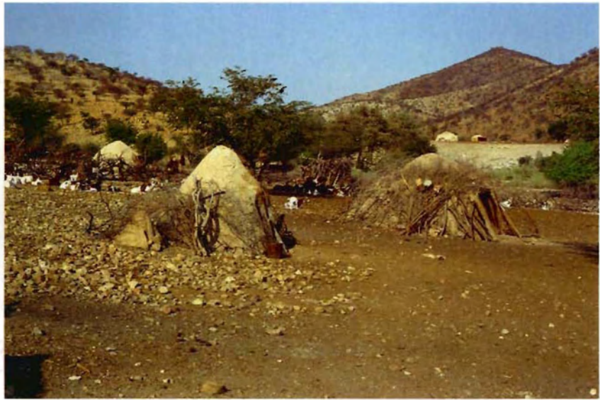
Fig. 4 Die Himba-Siedlung Omumakisua östlich von Epupa mit der Wohnhütte der Zweitfrau (rechts) und der der Drittfrau außerhalb des Kraals (im Hintergrund links)

Das Hauptproduktionsziel der traditionellen Wirtschaftsweise der Himba ist die stetige Mehrung der Rinderherden. Die Tatsache, dass dies nicht in erster Linie zur Sicherung der Eigenversorgung geschieht, sondern vielmehr aus religiösen bzw. prestigebedingten