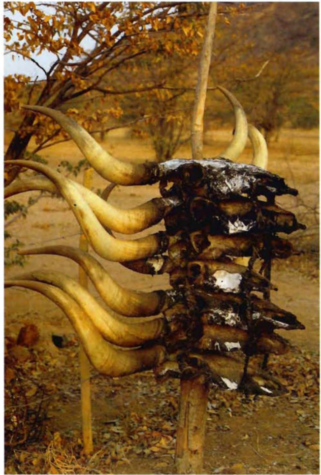
Fig. 2 Aufgestapelte Schädel von Rindern aus der obersten Klasse an der Begräbnisstelle von TUAREKAREKA RUJINDO südlich von Epupa am Kunene Stacked cattle skulls from the highest cattle class at the grave of TUAREKAREKA RUJINDO, south of Epupa at the Kunene river

Wie sehr die beiden Kulturelemente, sakrale Rinderzucht und Ahnenverehrung, die täglichen Lebenswelten der Himba bestimmen, vermittelt auf besonders eindrückliche Weise die charakteristische Ausrichtung und innere Gliederung ihrer Siedlungen. Heute leben die ca. 7800 Himba des Kaokolandes in 52 traditionellen Siedlungen. Diese Wohnplätze, an denen selten mehr als 100 Menschen zusammen leben, sind nur im weitesten Sinn als Dörfer zu bezeichnen. In erster Linie handelt es sich um nicht permanent und nicht immer von allen Gruppenmitgliedern gleichzeitig besetzte Wohnplätze einer Großfamilie. Stellvertretend für andere traditionelle Siedlungen im Kaokoland sei hier die innere Gliederung von Omumakisua am Südufer des Kunene zwischen Ruacana und den Epupa-Fällen dargestellt (Fig. 3):