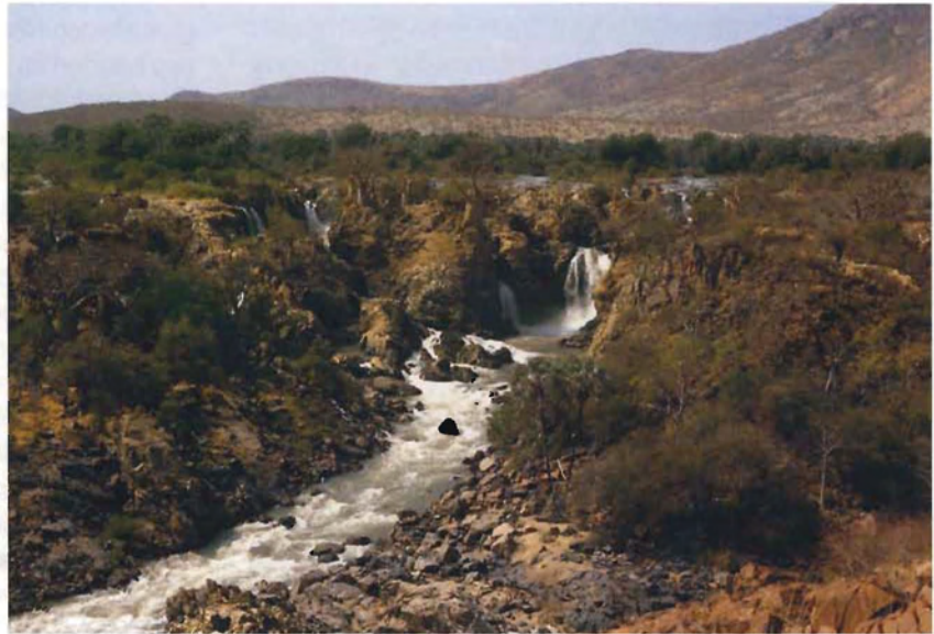
Fig. 1 Die Epupa-Fälle am Kunene, dem Grenzfluss zwischen Namibia und Angola. Ein geplantes Staudammprojekt würde hier nicht nur ein einmaliges Ökosystem, sondern auch die Grabstätten der Himba-Ahnen überfluten. The Epupa falls of the Kunene river at the border between Namibia and Angola. A proposed project to build a dam there would not only destroy an important ecosystem but also flood traditional Himba burial sites and holy ground.

Die Lebenssituation der Himba in Nordwestnamibia ist durch eine ausgeprägte, mehrfach bestimmte Peripherielage gekennzeichnet. Diese drückt sich nicht nur in der räumlichen Peripherie ihres Lebensraumes in einem abgelegenen, lange von der Außenwelt abgeschlossenen und bis heute schwer zugänglichen Gebiet im äußersten Nordwesten des afrikanischen Entwicklungslandes aus. Vielmehr wird das Leben der Himba darüber hinaus von einer Vielzahl weiterer Abseitslagen geprägt, die ihren Ausdruck vor allem in