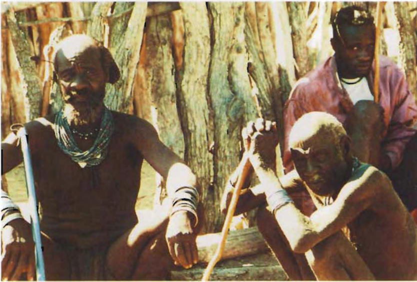
Fig. 10 Der Sippenälteste (links) von Omugomoure (Platz, wo ein hoher Berg ist), einer der größeren Himba-Siedlungen östlich von Opuwo The clan eldest (left) of Omugomoure (place where a big hill is), one of the larger Himba settlements east of Opuwo