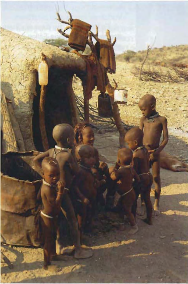
Fig. 8 Eine Verwandte der Hauptfrau des Sippenältesten von Omumakisua vor dessen Wohnhütte A female relative of the first wife of the clan eldest of Omumakisua in front of his dwelling