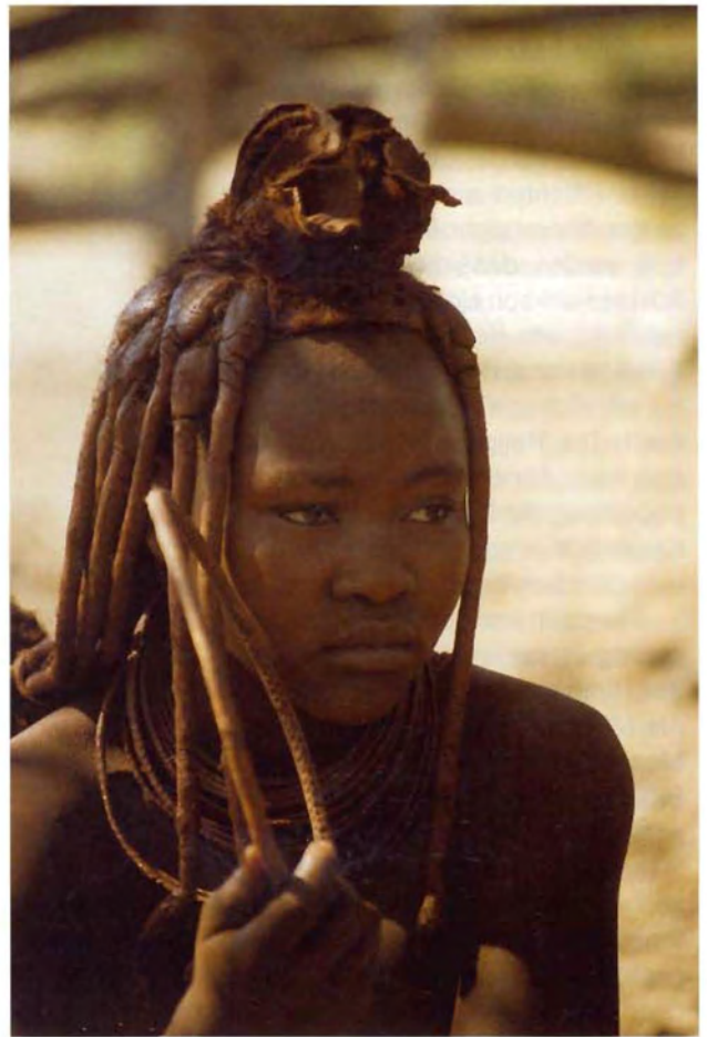
Fig. 7 Kennzeichen verheirateter Frauen ist die Ekori-Haube aus Leder, deren Vorderteil Kuhhörner nachbilden soll.

The ekori bonnet is the distinguishing mark of a married woman. Its front is said to symbolize cattle horns.