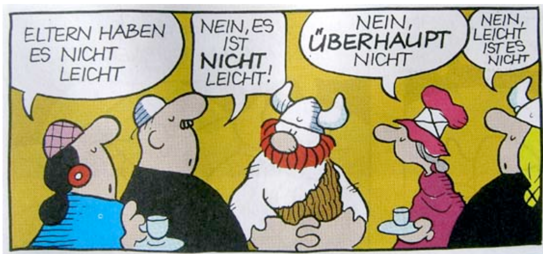
Abb. 6: aus: Dik Browne, Hägar der Schreckliche . Bd. 7. Badefreuden, Stuttgart 1991 (Delta-Verlag), S. 25

Die Funktion der Rede-Texte für die Lenkung des Rezipienten wird beim Einzelbild besonders evident. Denn dem Einzelbild fehlt die Zeitachse, die durch die Wiederholung der Figuren (mit handlungsrelevanten Veränderungen) in der Bildsequenz gegeben ist; das Einzelbild muß die Zeitdimension selbst markieren, wenn signalisiert werden soll, daß es einen Handlungsverlauf mit Verursachung und Folge erzählt. 38 Zur Illustration sei zunächst ein kurzer Blick auf ein Comic-Bild aus der Serie Hägar der Schreckliche von Dik Browne geworfen (Abb. 6).