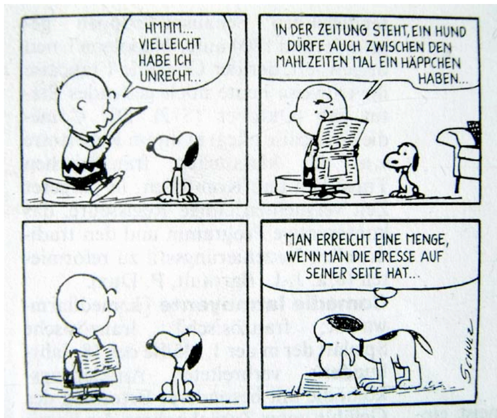
Abb. 5: : aus: Charles M. Schulz, Snoopy & die Peanuts. Bd. 46. So und Tschüss, Frankfurt a.M. 2002 (Krüger Verlag)

Was die text-bildliche Gestaltung dieser beiden Szenen angeht, so kann man feststellen, daß schon die formale Darstellung keineswegs ‚naiv‘ ist. Die Differenzierung zwischen Denken und Sprechen der Figuren wird durch die unterschiedlichen Ausgangspunkte der Buchstabenkette zum Ausdruck gebracht, ganz entsprechend zu der klassischen Unterscheidung für Äußerungen in Comics, bei denen Denkblasen den Figuren mit Bläschen oder Wölkchen zugeordnet sind. Hier ein Beispiel mit dem gedankenreichen Hund Snoopy, ebenfalls aus den Peanuts (Abb. 5).