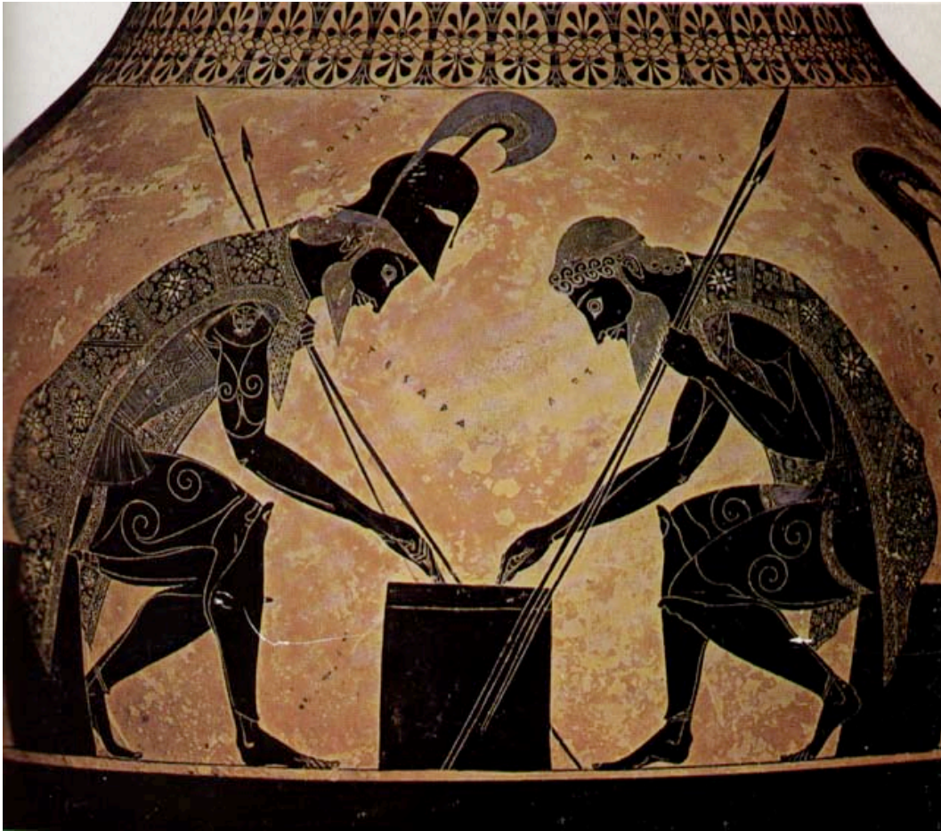
Abb. 8: Vatikanstadt, Museo Gregoriano Etrusco Vaticano, Inv. 344 / 16757: schwarzfigure Amphora aus Vulci (Etrurien); Abb. nach: Simon 1981, 74, XXV

Hier werden unter anderem die Namen der beiden Spieler angegeben, aber es sind die ihren Mündern entströmenden Zahlenangaben – bei dem als Gewinner charakterisierten Achilleus τέσσαρα und bei dem ewigen Verlierer Aias τρία –, 53 die einen szenischen Ablauf markieren. 54