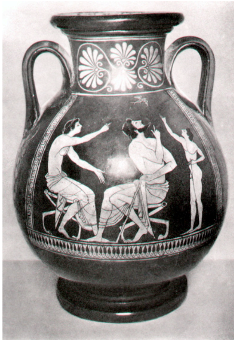
Abb. 4: St. Petersburg, Eremitage, Inv. 615: rotfigurige Pelike aus Vulci (Etrurien); Abb. nach: Waldhauer 1927, Beilage 1

Mit diesen Vasenbildern werden sowohl eine Bilderfolge als auch ein Einzelbild, das in moderner Terminologie einem Cartoon entspräche, 20 in die Betrachtung einbezogen. Sie zielt auf den Nachweis von prinzipiell möglichen Strukturen; eine stilistische Untersuchung oder eine archäologische Einordnung der aufgewiesenen Phänomene ist nicht intendiert.