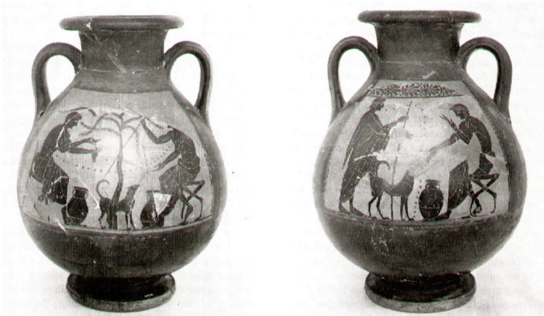
Abb. 3: Vatikanstadt, Museo Gregoriano Etrusco Vaticano, Inv. 413: schwarzfigurige Pelike aus Cerveteri (Etrurien); Abb. nach: Shapiro 1997, 64

eingehendere Analyse der Erzählstruktur in den beiden Bildern der auch von der Comic-Forschung beachteten ‚Ölhandel-Vase‘ im Vatikan sein (Abb. 3). 17