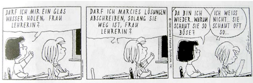
Abb. 1: aus: Charles M. Schulz, Snoopy & die Peanuts. Bd. 46. So und Tschüss, Frankfurt a.M. 2002 (Krüger Verlag)

Als Beispiel sei ein klassischer Comicstrip aus den Peanuts von Charles M. Schulz betrachtet (Abb. 1).