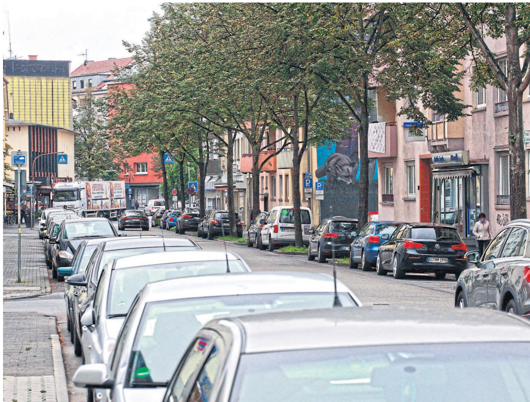
Auch diese Parkplätze in der Walltorstraße müssten verschwinden, wenn die autofreie City innerhalb des Anlagenrings Realität wird.

■ Straßenverkehr: Das von Stadtrat Wright präsentierte Kapitel unter der Überschrift »Für eine Verkehrswende« in Gießen ist das umfangreichste