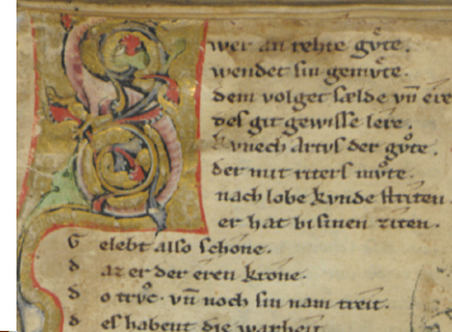
Hartmann von Aue: Iwein. Süddeutschland, zweites Viertel des 13. Jahrhunderts. UB Gießen, Hs 97.

auch neuzeitliche Autographen von Justus Liebig, Conrad Röntgen und Walter Benjamin befinden, sind die Sammlungen von Inkunabeln und Postinkunabeln und von studentischen Stammbüchern des 17.-19. Jahrhunderts von herausragender Bedeutung. International bekannt ist darüber hinaus die GIESSENER PAPYRUSSAMMLUNG , die mit 2300 Fragmenten eine der größten Sammlungen in Deutschland ist. Ihr bedeutendstes Stück ist die weltweit einzige erhaltene fragmentarische Abschrift des Originalwortlauts der 212/3 erlassenen CONSTITUTIO ANTONINIANA Kaiser Caracallas. Darin wird allen freien Einwohnern des Römischen Reiches das römische Bürgerrecht verliehen. 2017 ist dieser Papyrus in das Weltdokumentenerbe („Memory of the World“) der UNESCO aufgenommen worden.