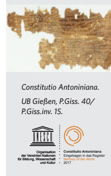
Constitutio Antoniniana. UB Gießen, P.Giss. 40/ P.Giss.inv. 15.