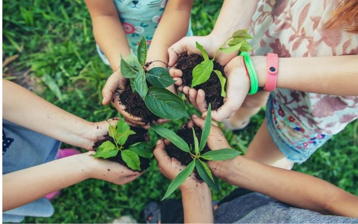
Abb. 8: Sustainability