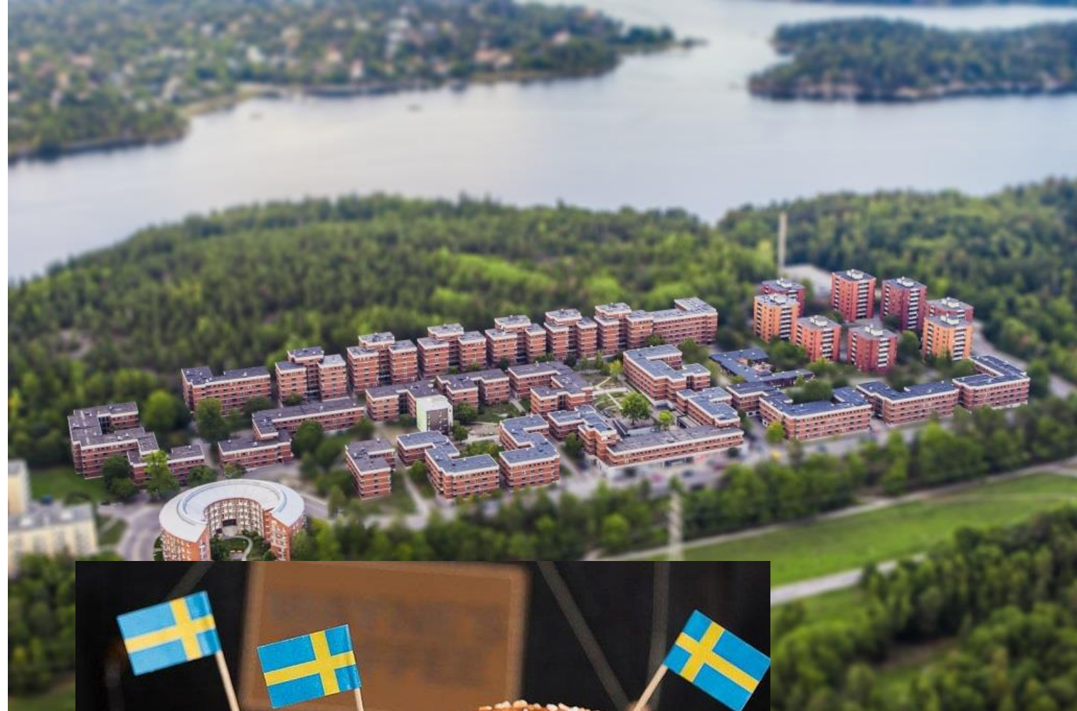
Abb. 10: Campus Lappis