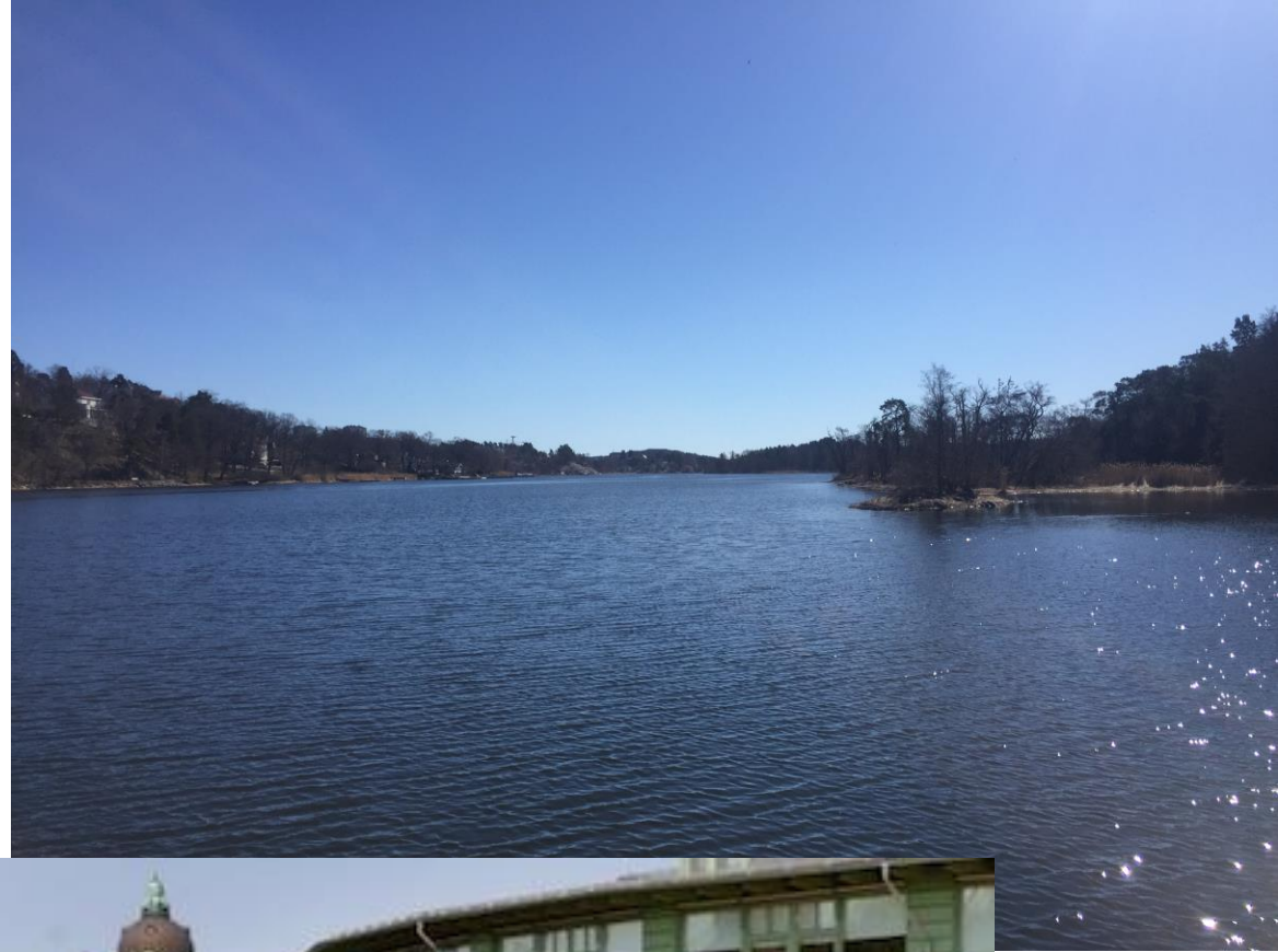
Abb. 6: Blick nahe Stockholm