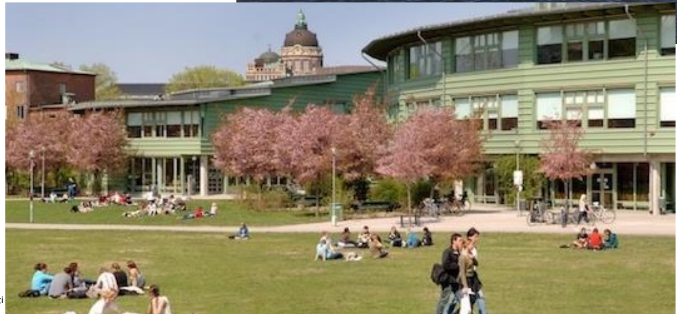
Abb. 5: Campus Frescati