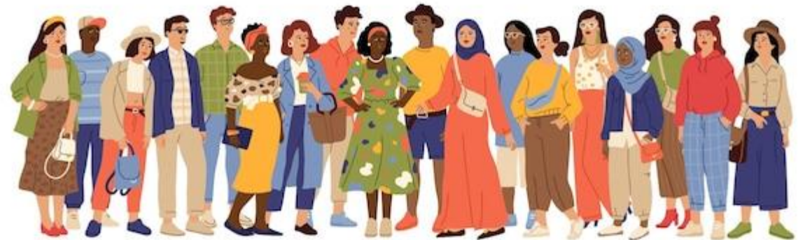
Abb. 7: Multikulturell