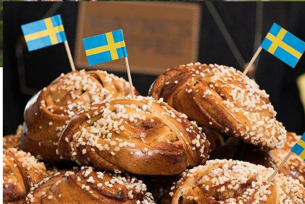
Abb. 9: Kanelbulle