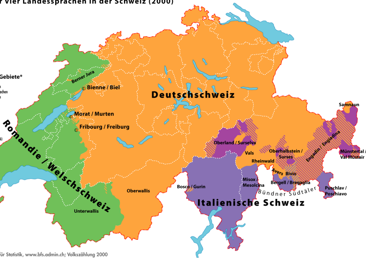
Die vier Landessprachen in der Schweiz (2000)