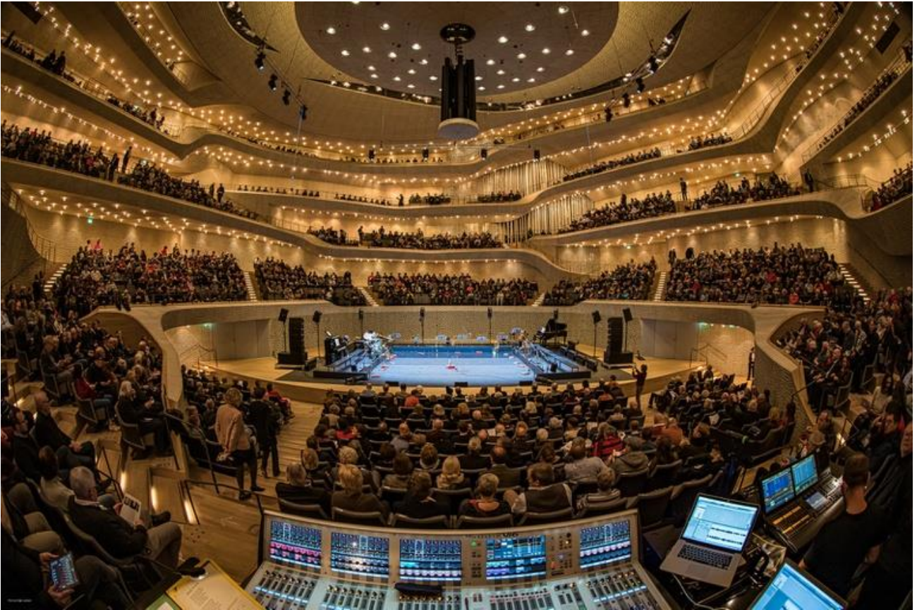
Bühnenaufbau Eislermaterial in der Elbphilharmonie Hamburg.

Anfang Februar konnte in der Hamburger Elbphilharmonie vor vollem Haus noch Eislermaterial mit Josef Bierbichler und dem Ensemble Modern aufgeführt werden.