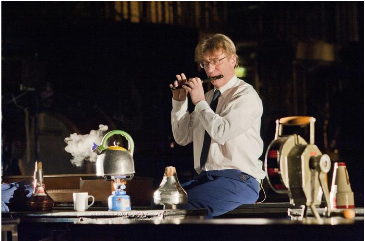
„Schwarz auf Weiß“.

Auch die für Mitte April geplanten Vorstellungen des Stückes „Макс Блэк или 62 способа подпереть голову рукой“ (zu Deutsch „Max Black oder 62 Arten den Kopf mit der Hand zu stützen“) am Electrotheater in Moskau mussten ausfallen; stattdessen hat das Theater vom 13. bis 17. April 2020 eine 6-teilige Reihe von Videostreamings von und mit Heiner Goebbels ins Programm genommen: einen Vortrag am Electrotheater; ein Gespräch „Zur Kritik der Repräsentation und Narrativität im Theater“, zusammen mit dem Intendanten Boris Yukhananov, die Präsentation der russischen Ausgabe des Buches von Heiner Goebbels „Ästhetik der Abwesenheit“, ein Komponistengespräch über „Action as Music“ zwischen Heiner Goebbels und den russischen Kollegen Alexander Manotskov und Vladimir Gorlinsky, eine Publikumsdiskussion zu „Max Black, or 62 Ways of Supporting the Head with a Hand“ - sowie einen kompletten Videomitschnitt des Musiktheaterstückes nach Texten von Lichtenberg, Valery, Wittgenstein und Max Black.