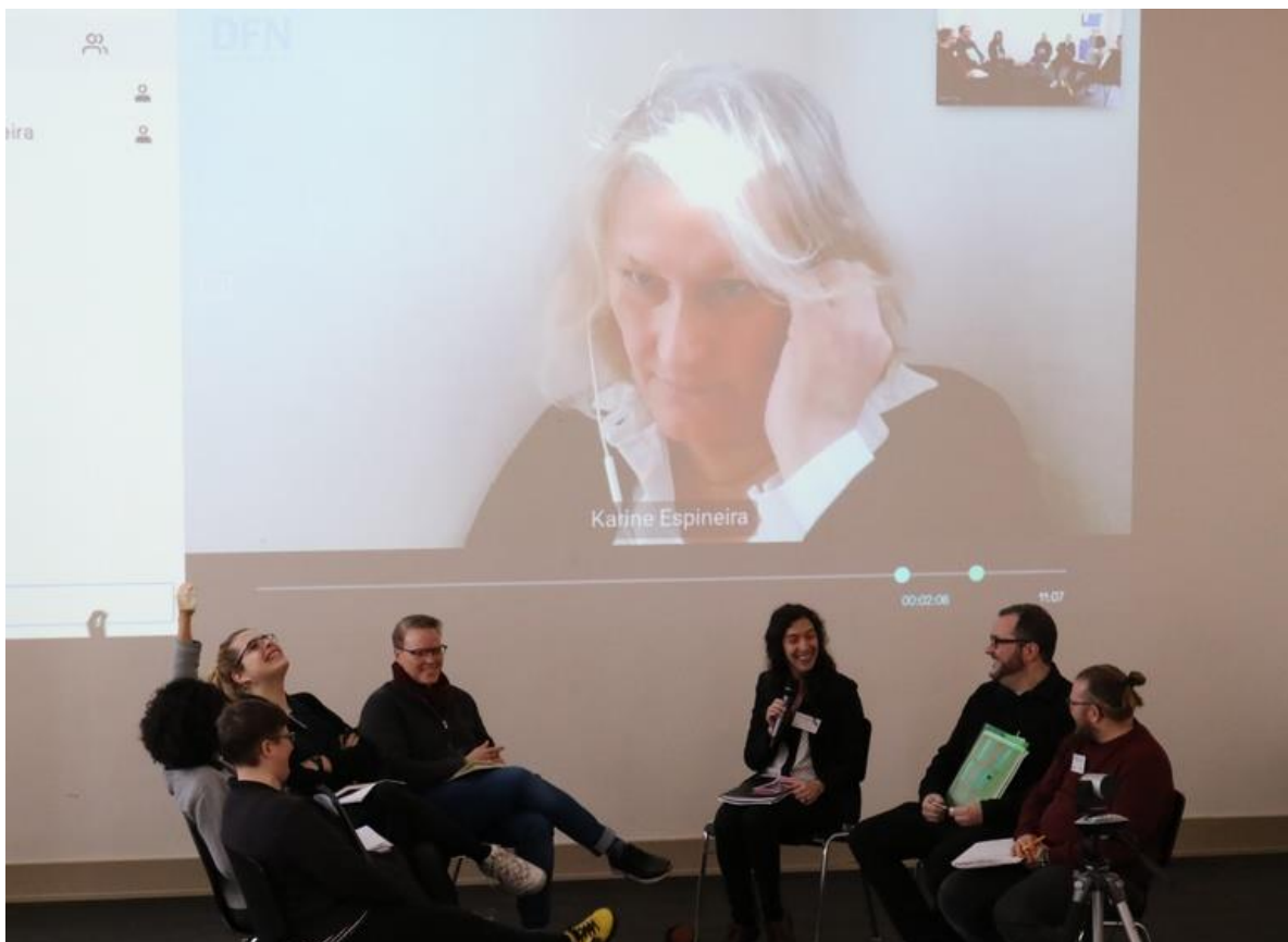
Abschließende Diskussionsrunde der Referent*innen der internationalen Trans*-Tagung.

Die Tagung war sehr erfolgreich. Hervorzuheben sind die intensiven und fruchtbaren Diskussionen und das aktiv eingebundene Publikum. Die Teilnehmer*innen haben sich besonders mit dem Topos der leidenden, nackten Trans* Figur vor dem Spiegel und der pathologisierenden Rolle dieser Darstellung auseinander gesetzt, die eine Art voyeuristische "pornography of suffering" sei. Dieser Topos sei ein Beispiel dafür, dass – um mit dem Terminus von einem der Teilnehmer der Tagung, Baumgartinger, zu argumentieren – die Darstellung von trans* Personen noch mehrheitlich auf dem Transsexualismus-/Transsexualität-Paradigma aufbaut. Das Feedback aus dem Publikum fiel besonders positiv aus. Die entspannte, nicht-elitäre und integrative Atmosphäre der Konferenz, die einen wahren Dialog zwischen Forscher*innen aller Generationen und Statusgruppen, Student*innen und dem außerwissenschaftlichen Publikum ermöglichte, wurde besonders geschätzt. Aussichtsvoll war das feste Versprechen, mit dem die Konferenz endete: die Veröffentlichung eines Buches, das die diskutierten Probleme vertiefen und darüber hinaus gehen soll, um Beispiele von alternativen Darstellungen jenseits des Transsexualismus-/Transsexualität-Paradigmas aufzuzeigen und zu erläutern.