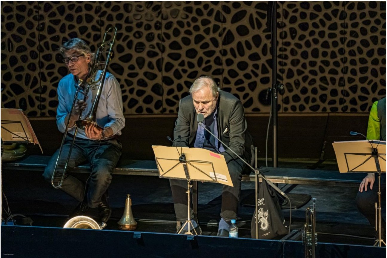
Josef Bierbichler singt Bertolt Brecht / Hanns Eisler.