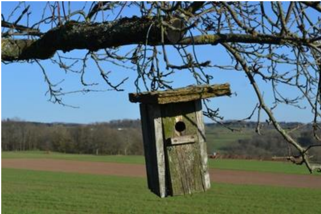
Vogelsberg, April 2020.

In ihrem Blog-Beitrag äußert sich Prof. Dorothée de Nève , die stellvertretende Geschäftsführende Direktorin des ZMI, zum Thema Homeoffice . Alle Leser*innen sind herzlich eingeladen, diesen Beitrag zu kommentieren.