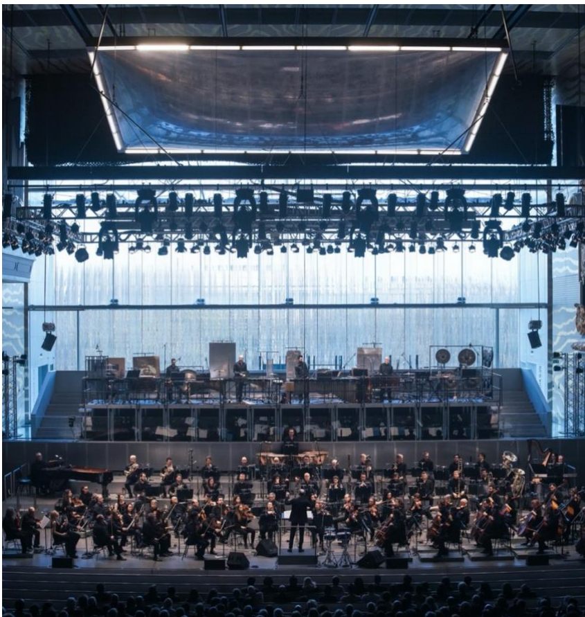
Das Orchesterstück „Surrogate Cities“ in der Casa da Música in Porto.

Anfang März war die portugiesische Erstaufführung des Orchesterstücks Surrogate Cities in Porto zu erleben, bevor auch der Spielbetrieb in der dortigen CASA DA MUSICA eingestellt werden musste.