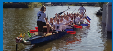
Hoch die Hände: Die UNI-Drachen nach getaner Arbeit.

Der 15. Gießener Drachenboot-Cup fand am 18. August 2018 erstmals unter Beteiligung der UNI-Drachen statt. Gleich bei ihrer ersten Regatta erpaddelte sich das JLU-Team einen hervorragenden 4. Platz im „Fun-Cup“-Rennen. Die erfolgreiche Truppe formierte sich aus dem ahs-Kurs „Drachenbootfahren“, welcher im Sommersemester 2018 neu in das Sportprogramm aufgenommen wurde. Der Kurs findet in Kooperation mit dem WSV Hellas Gießen statt.