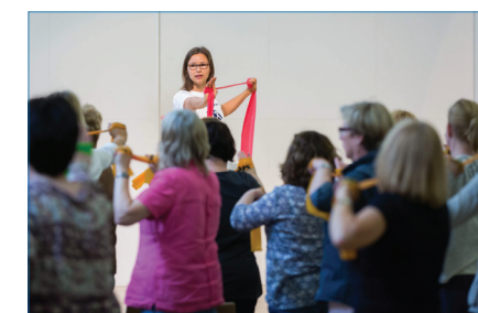
Der „JLU-Pausenexpress“ beim Office Day 2016.

Wir danken all unseren treuen und aktiven Teilnehmerinnen und Teilnehmern und freuen uns auf die weiteren bewegten Jahre mit Ihnen.