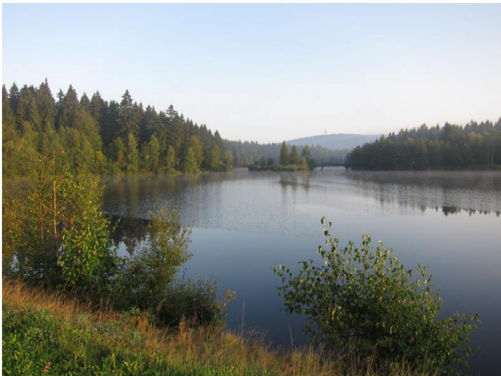
Impressionen vom Fichtelsee, mit Blick auf den Schneeberg, mit 1051 m üNN der höchste Berg Nordbayerns.