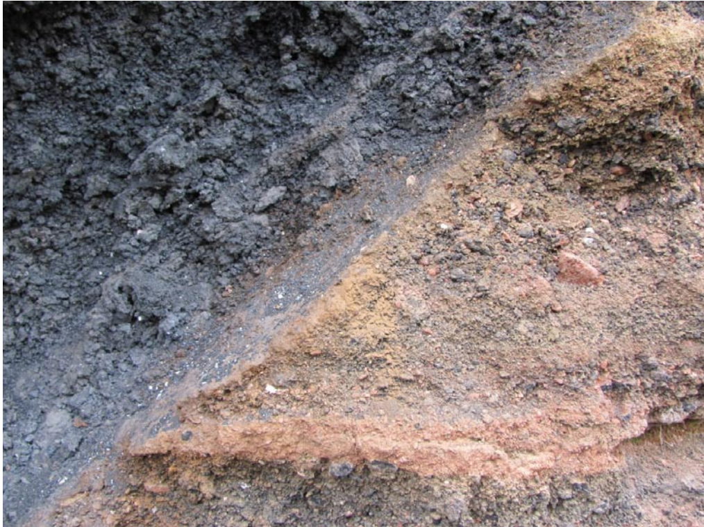
Detailaufnahme der dunklen Schlacken (strombolianische Aktivität) und der durch phreatomagmatische Explosionen entstandenen Abfolgen (rechts unten)