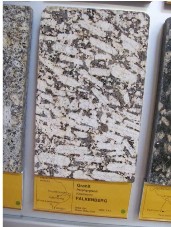
Polierte Musterplatte des Falkenberger Granits in der Gesteinsammlung des Deutschen Natursteinarchivs in Wunsiedel. Der Falkenberger Granit gehört zu den Oberpfälzer Graniten und ist gekennzeichnet durch seine stark porphyrische Struktur mit bis zu 10 cm langen Kalifeldspat-Leisten.