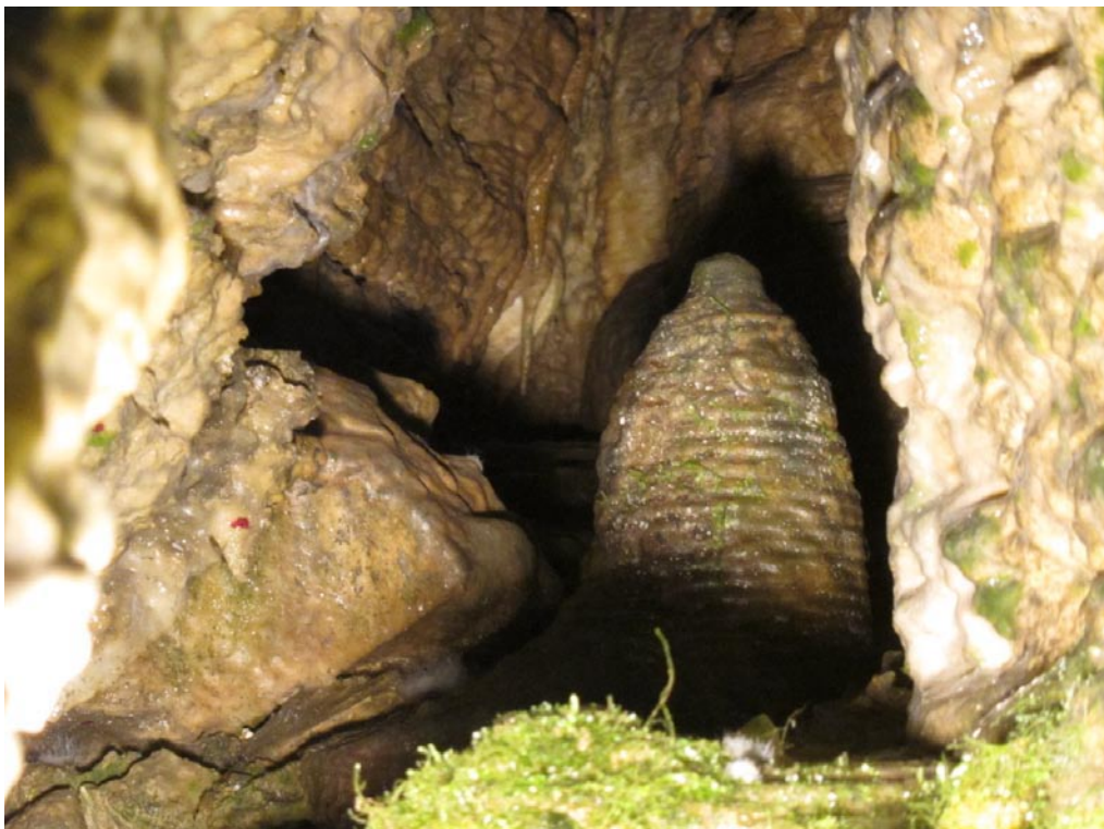
Der „Bienenkorb“, einer der raren Stalagmiten in der Teufelhöhle.