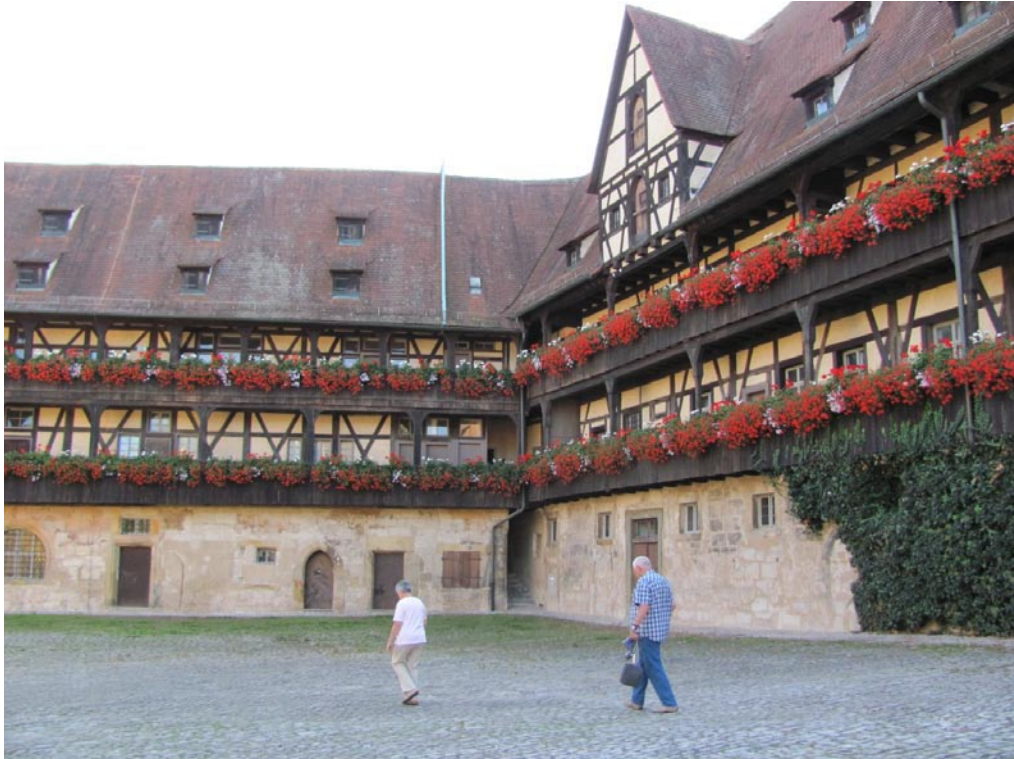
Blick in den Innenhof der Alten Hofhaltung, unmittelbar neben dem Kaiserdom St. Peter und St. Georg. Aus der beträchtlichen Wegdistanz zwischen Küche und Speisesaal der einstigen Kaiser- und Bischofspfalz wird der Überlieferung nach das Sprichwort „Es wird nichts so heiß gegessen wie gekocht“ abgeleitet.