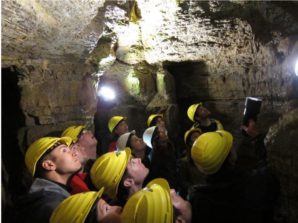
Impressionen aus der Teufelhöhle nahe Steinau an der Straße.