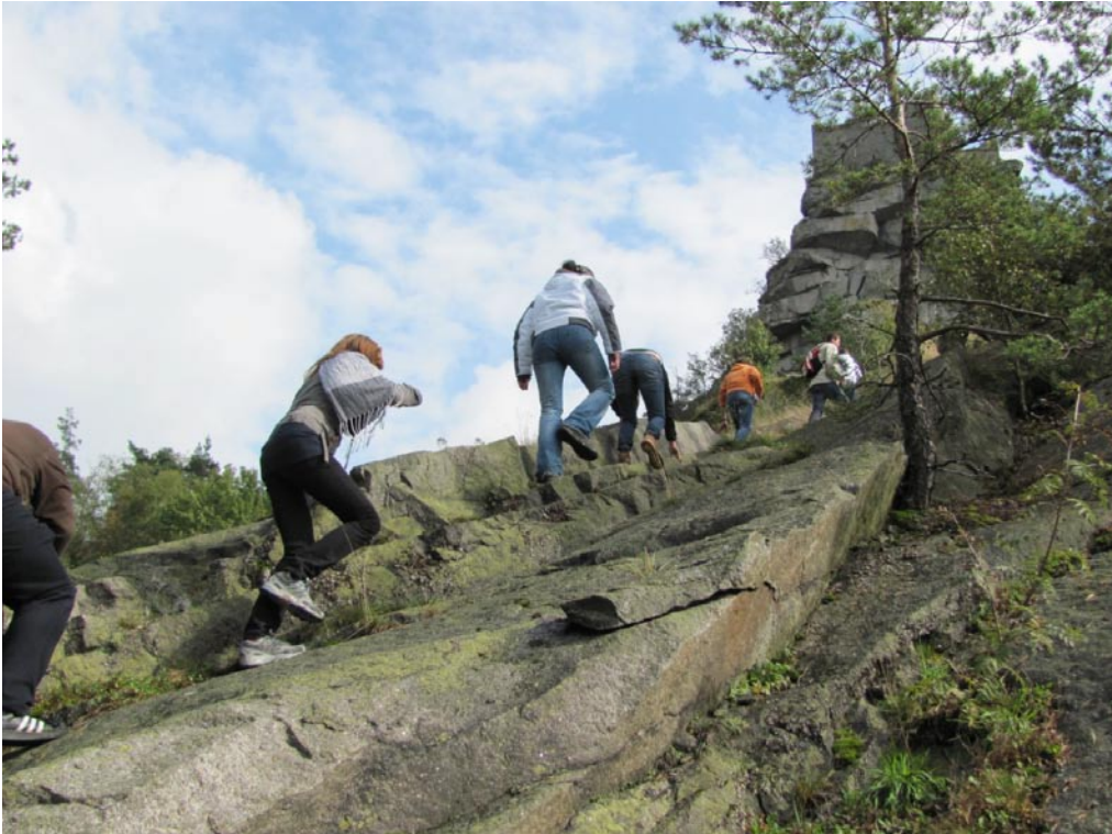
Aufstieg zum Flossenbürg-Gipfel