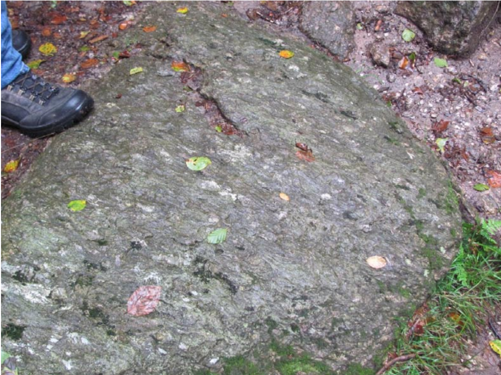
Altpaläozoische Augengneise südöstlich des Nußhardt-Gipfels