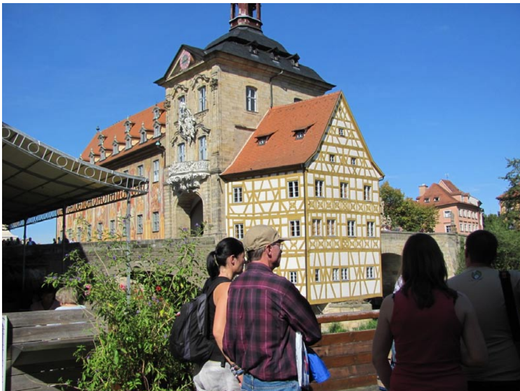
Das berühmte Bamberger Alte Rathaus auf der Regnitz-Brücke mit seinen vielfältigen Stilelementen.