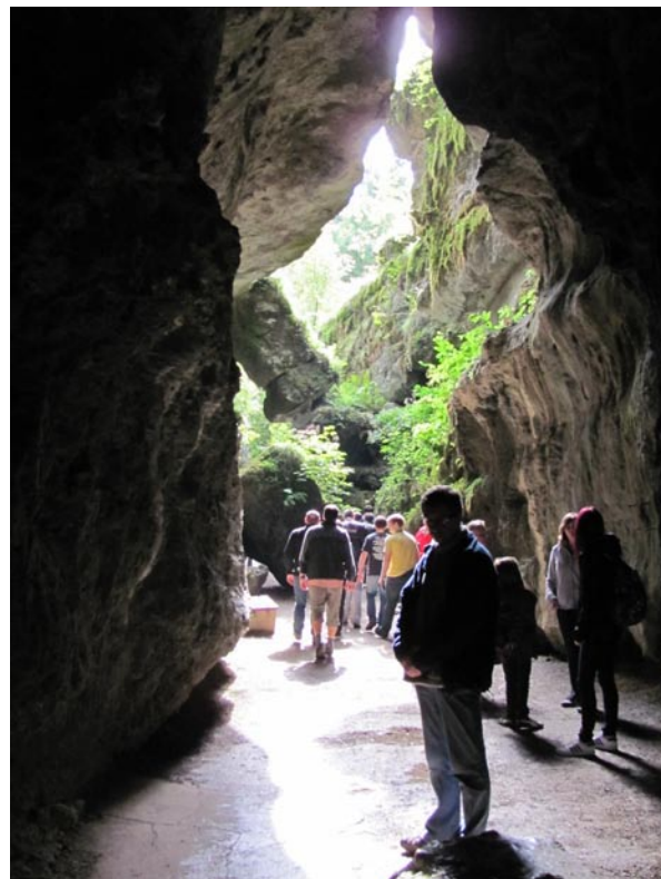
Am Ausgangsportal der Teufelhöhle. Das Ausgangsportal liegt mehrere 10er Meter über dem heutigen Vorfluter. Hier und in vielen anderen Bereichen der Höhle finden sich sowohl durch Korrosion (phreatisch) als auch durch Erosion (vados) dominierte Höhlenformen.