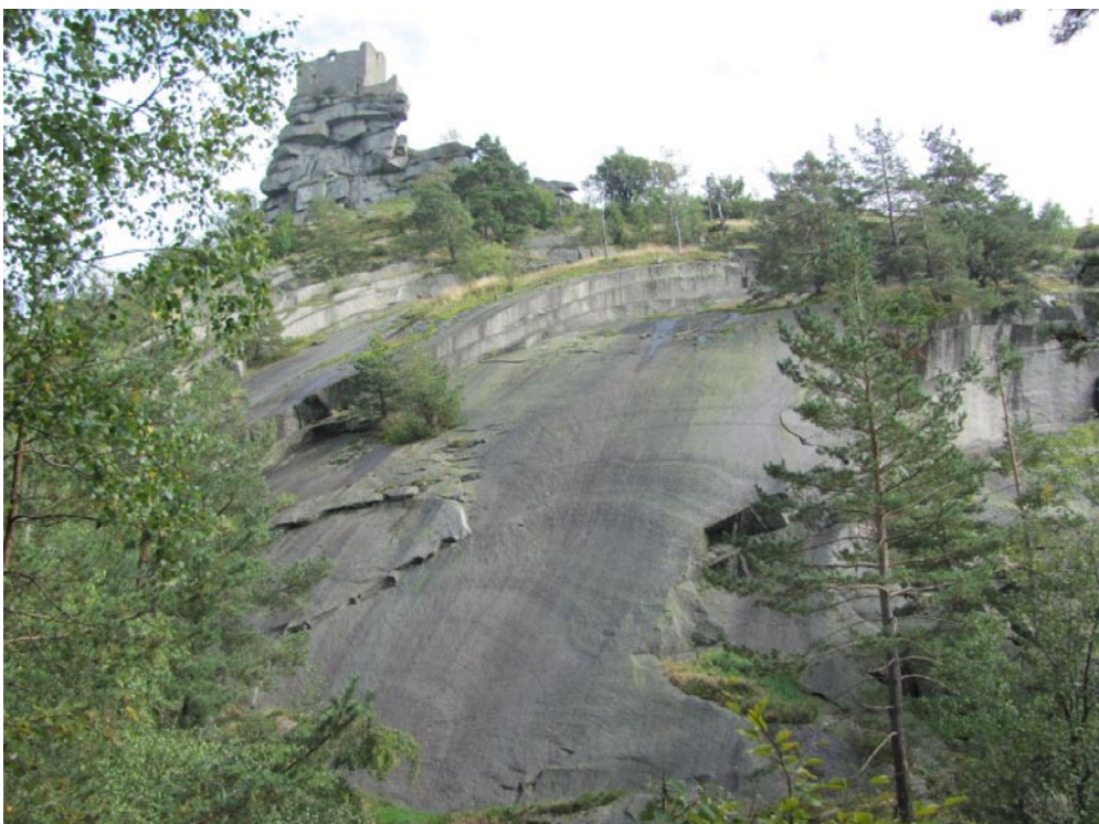
Flossenbürg – Blick nach Osten über den ehemaligen Steinbruch hinauf zur gleichnamigen Burgruine. Durch den Steinbruchbetrieb wurde die zwiebelschalige Absonderung des Flossenbürger Granits lehrbuchhaft aufgeschlossen.