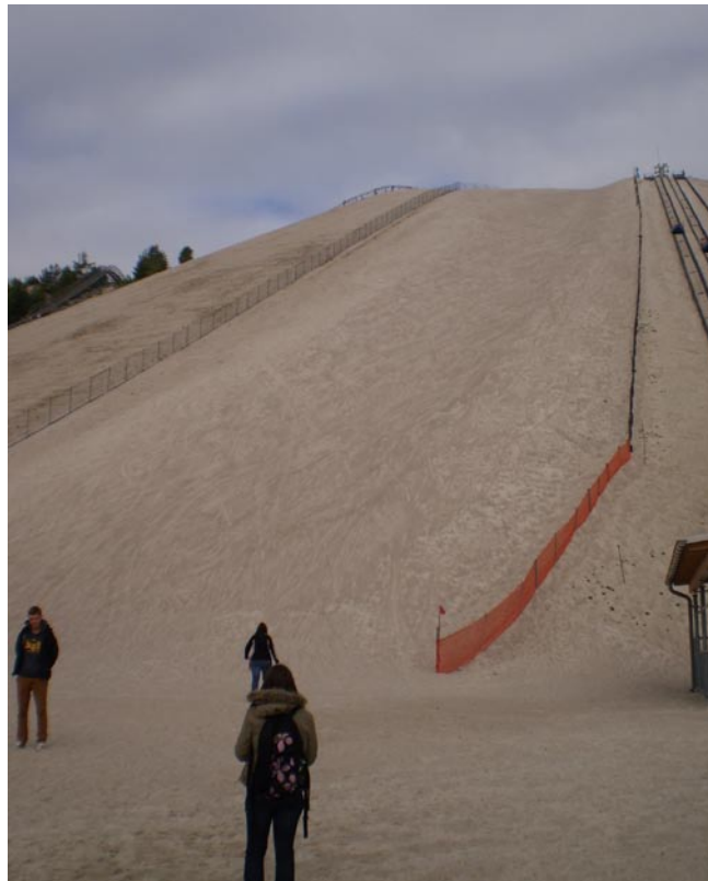
der Monte Kaolino in Hirschau, unmittelbar vor der Besteigung. Das Hirschau - Schnaittenbacher Kaolinrevier ist das bedeutendste in Deutschland. Der Mineralinhalt umfasst Quarz (70 - 85 %), Feldspat (8 - 12 %) und Kaolinit ( 10 - 25 %) in unterschiedlichem Mengenverhältnis.