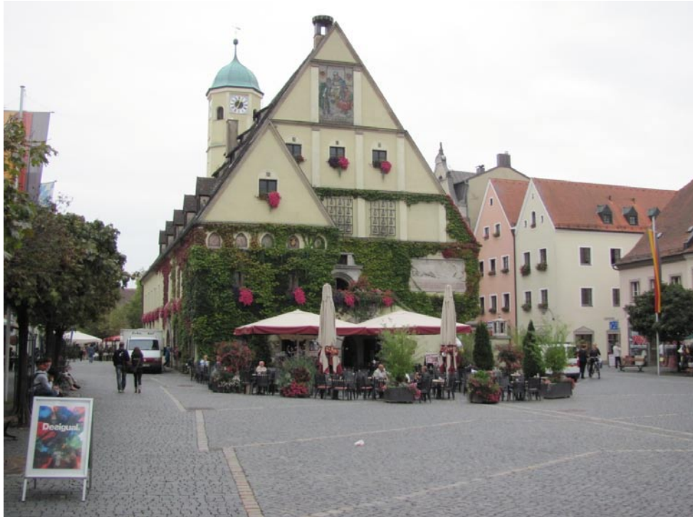
Straßenszene aus der historischen Altstadt von Weiden i.d. Oberpfalz.