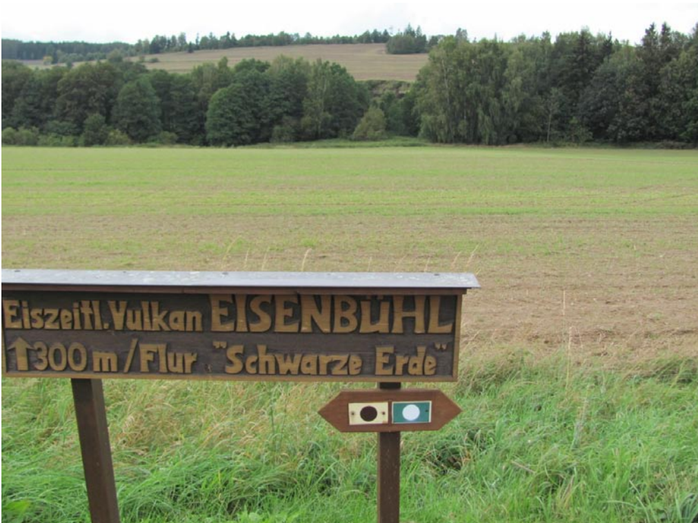
Blick vom der deutsch-tschechischen Grenze bei Neualbenreuth auf den spätquartären Vulkan Zelezná hora (Eisenbühl), Blick nach N.