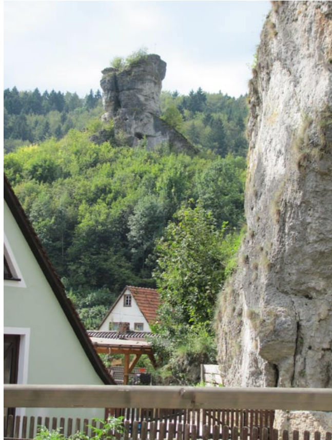
Kreidezeitlicher Kegelkarst in Tüchersfeld