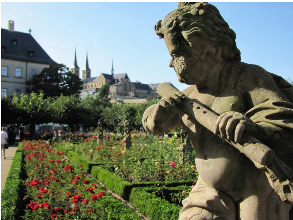
Impressionen aus dem Rosengarten der Neuen Residenz, mit Kloster St. Michael im Hintergrund.