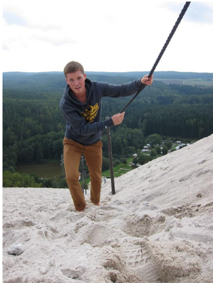
.. gleich ist es geschafft...