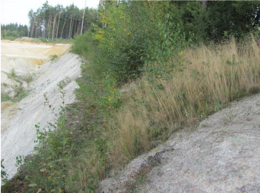
Am Rand der Grube Rappauf der Imerys Tableware, an der B 15 südlich Tirschenreuth i. d. Oberpfalz. Das Werk Schmelitz der Imerys Tableware mit den beiden Gruben Schmelitz und Rappauf ist ein bedeutender Arbeitgeber der Region. Die Aufbereitungs-Produkte (Quarz, Feldspat und Kaolinit) sind gefragte Rohstoffe für die Keramik- und Papierherstellung. Vielen Dank an Herrn Günter Griebshammer und Frau Cordula Krebs für die sehr interessante Werksführung.