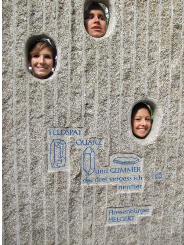
Ein Bild, das keines Kommentars bedarf