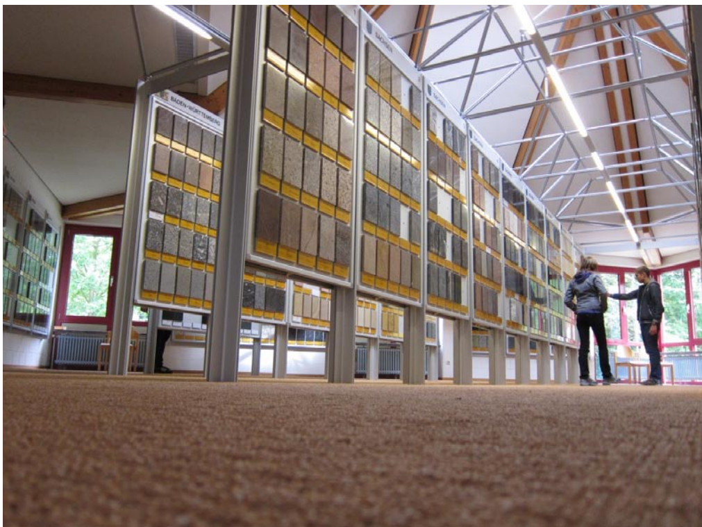
In der Gesteinssammlung des Deutschen Natursteinarchivs in Wunsiedel