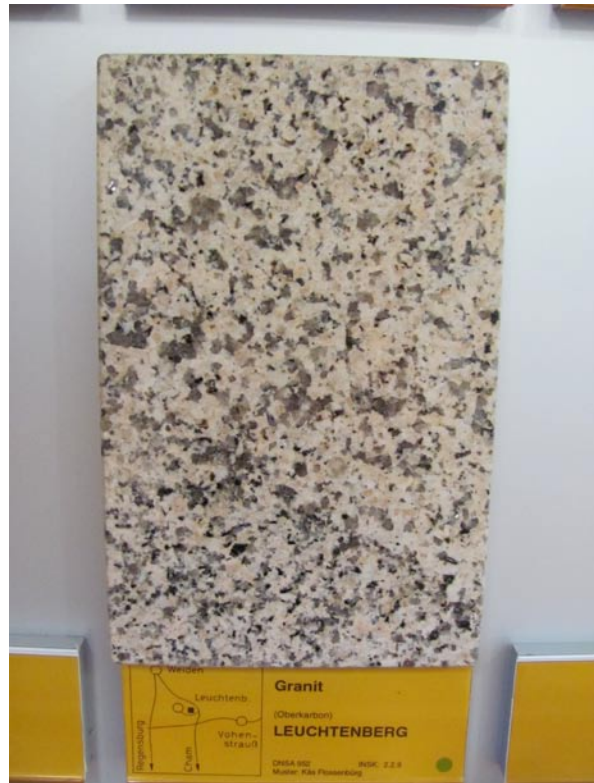
Polierte Musterplatte des Leuchtenberger Granits (Oberpfalz) in der Gesteinssammlung des Deutschen Natursteinarchivs in Wunsiedel.