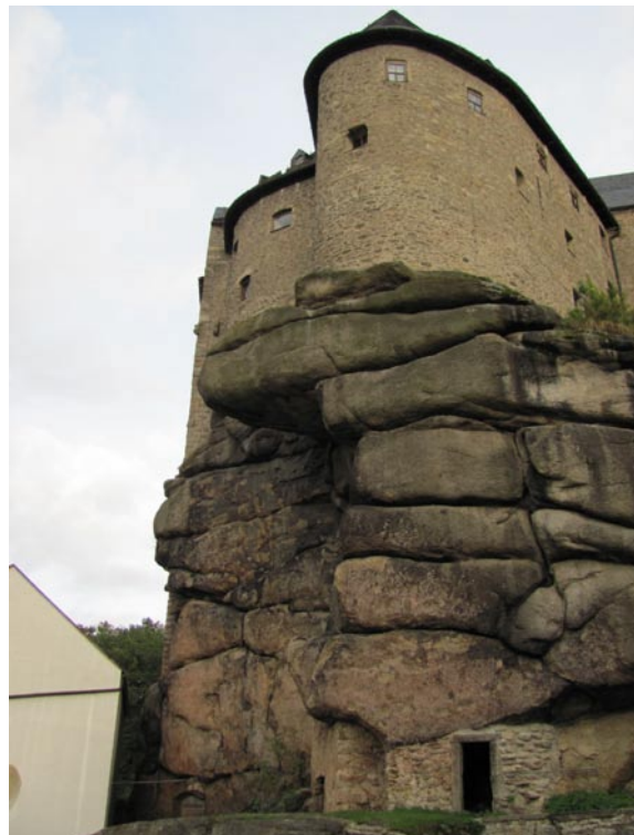
Markt Falkenberg in der Oberpfalz. Der Felsen, auf dem die Burg Falkenberg errichtet wurde, ist die Typlokalität des Falkenberger Granits, den wir bereits im Deutschen Natursteinarchiv in Wunsiedel kennengelernt haben. Die Gesteine zeigen die charakteristische Wollsackverwitterung, die auf ein orthogonales Kluftsystem zurückzuführen ist. Der Begriff „Wollsackverwitterung“ wurde hier erstmalig verwendet.