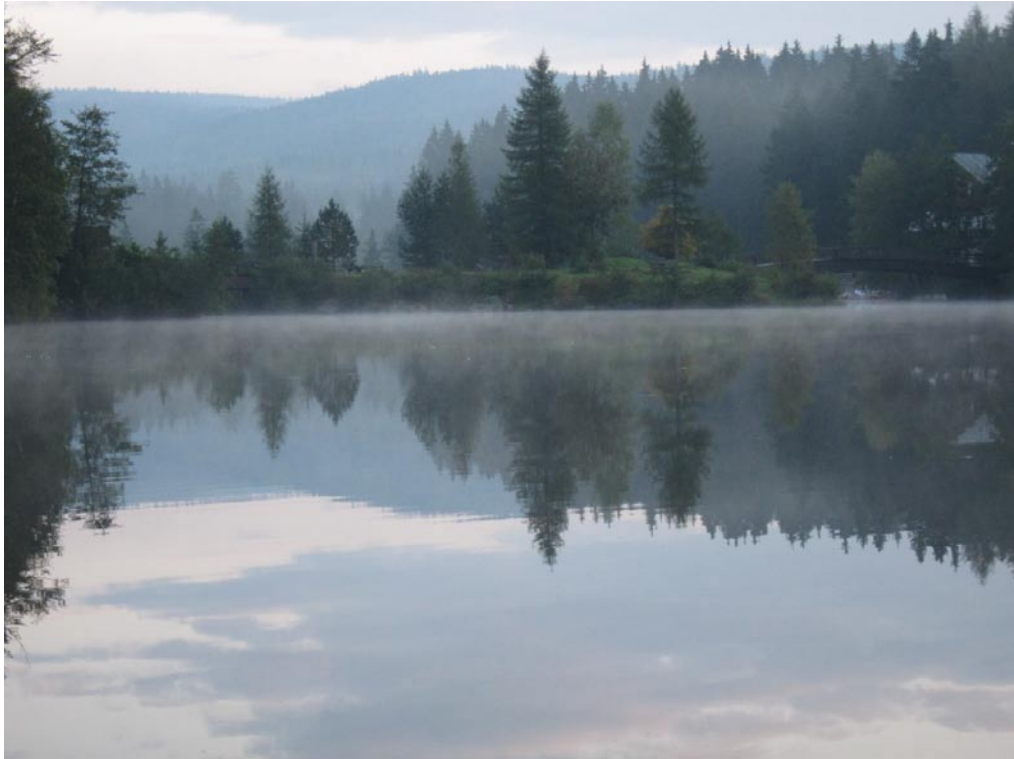
Abendliches Stimmungsbild von Fichtelsee