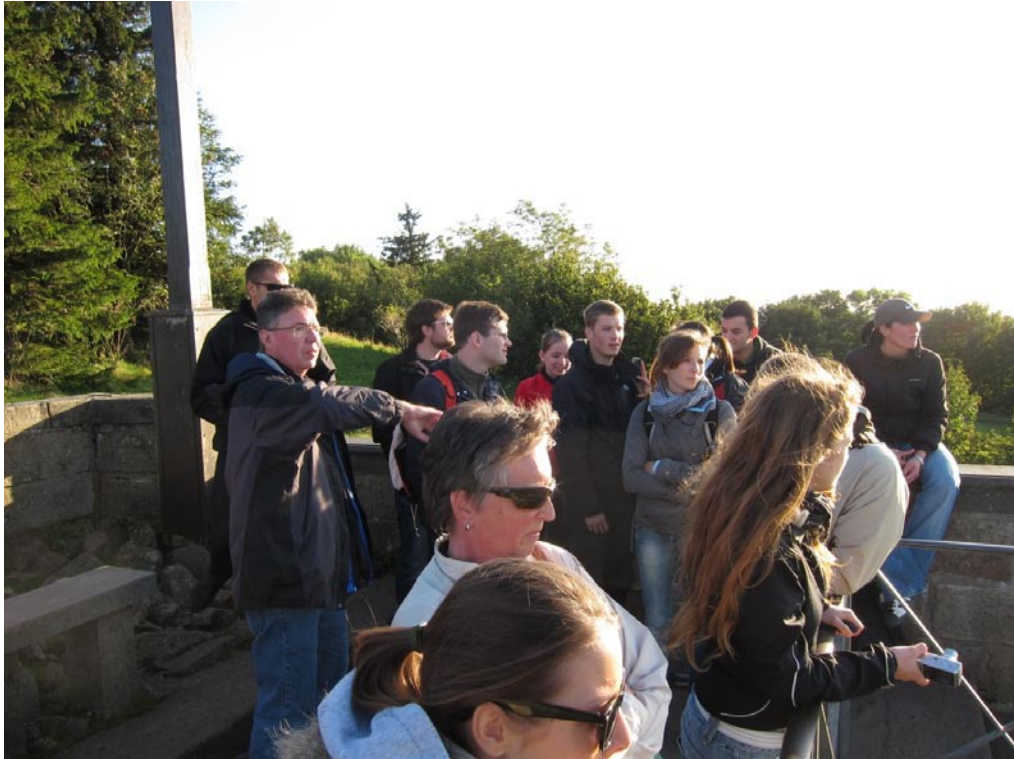
Auf dem Kreuzberg bei Wildflecken, dem heiligen Berg der Franken