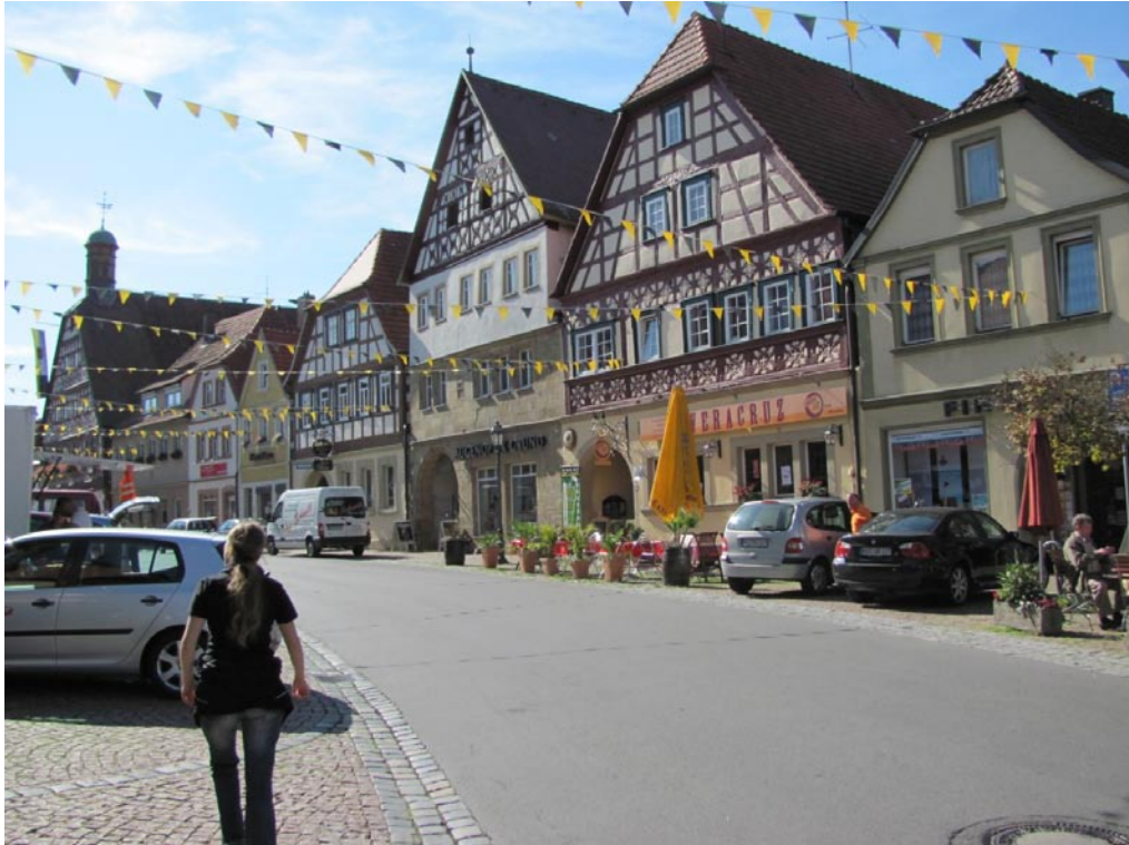
Straßenszene aus der kleinen Stadt Ebern in den fränkischen Hassbergen