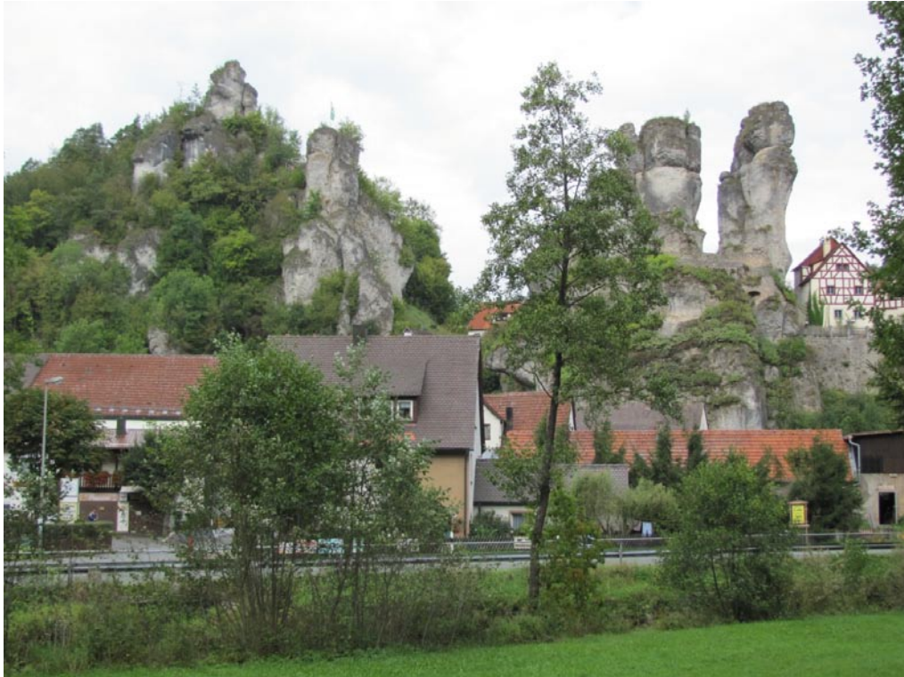
Die Kegelkarst-Silhouette von Tüchersfeld.