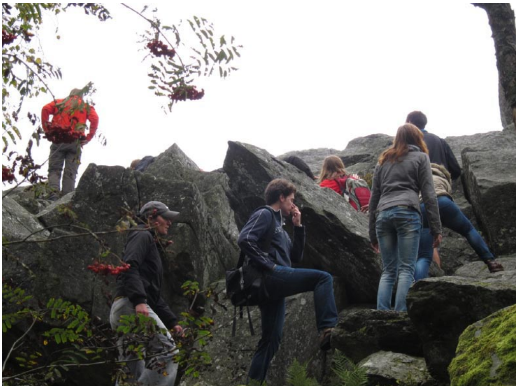
In der „Steinwand“. Bei der Steinwand handelt es sich um einen langgestreckten Phonolith-Körper, der im Miozän in die triassischen Schichten des Deckgebirges intrudierte, oberflächennah erstarrte und infolge seiner charakteristischen Verwitterungsresistenz heute als markant herauspräparierter Kletterfelsen genutzt wird.