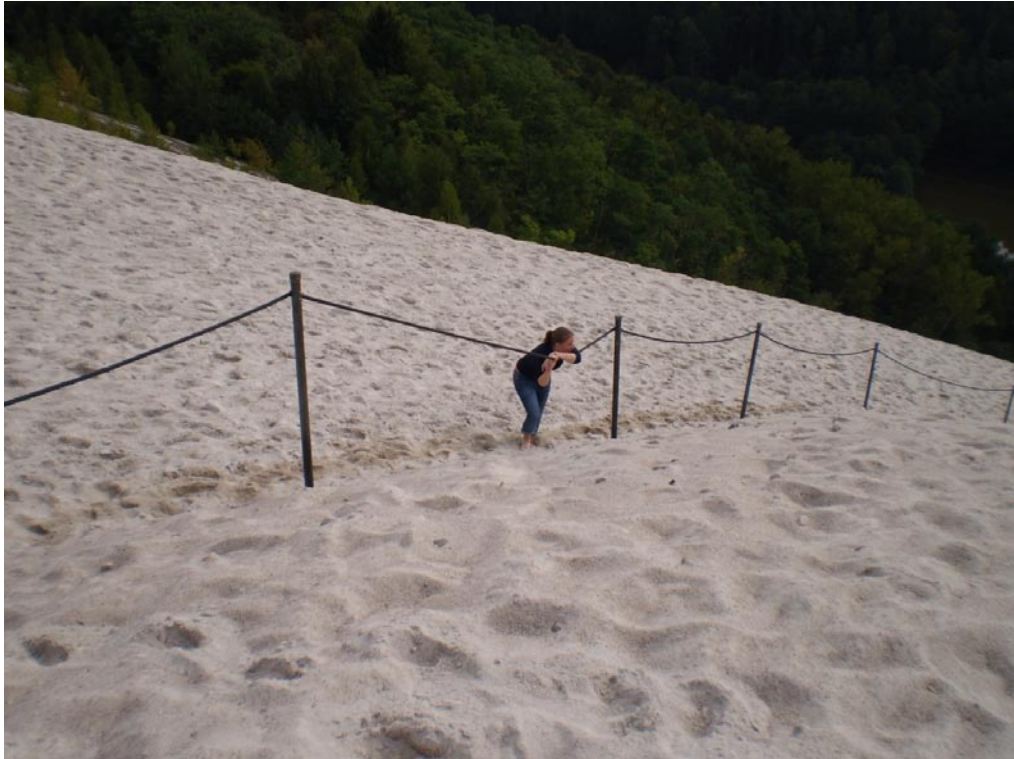
Der Monte Kaolino in Hirschau, Impressionen vom doch recht steilen Aufstieg.