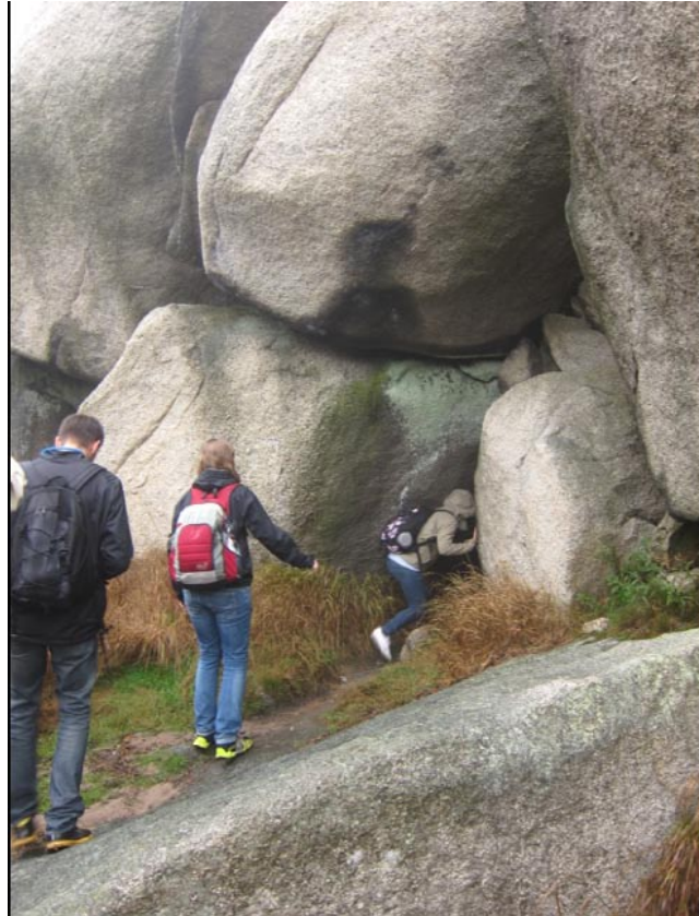
Die Studierenden beim gut versteckten Einstieg in die sagenumwobene Nußhardt-Stube