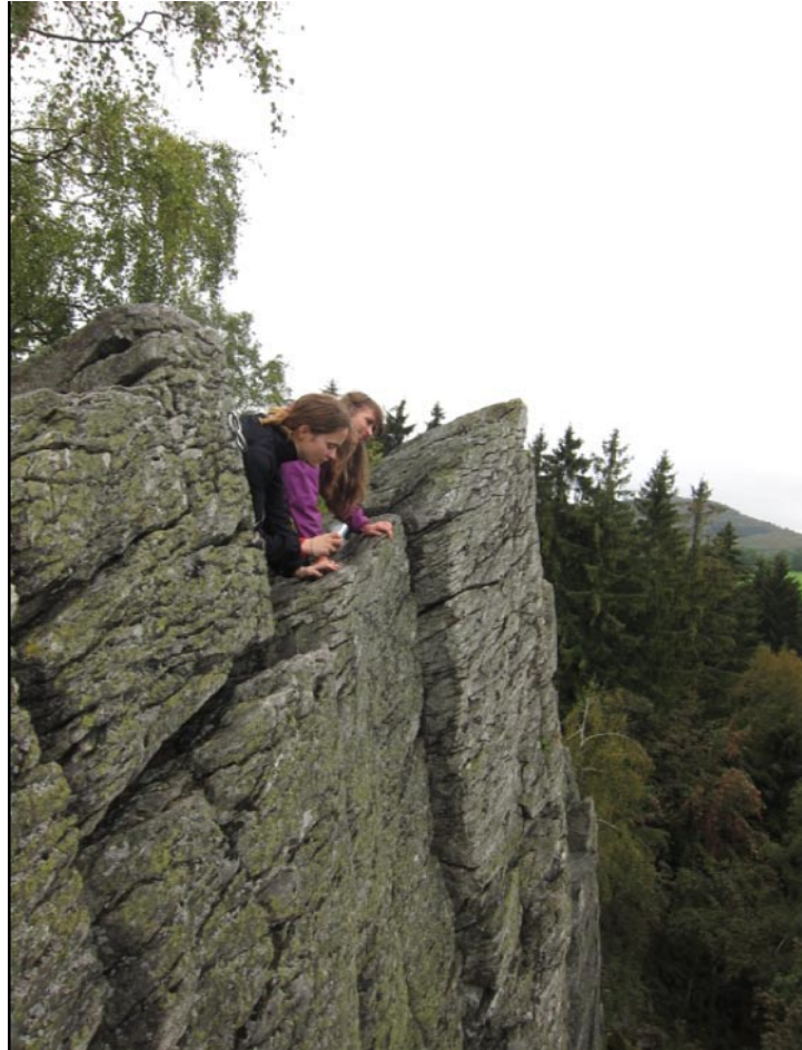
Im Gipfelbereich der Steinwand