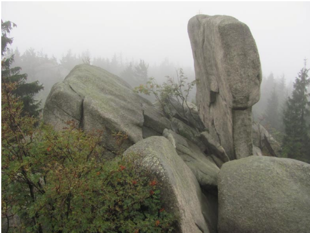
Impressionen vom Nußhardt-Gipfel. Hier steht der grobkörnige Kerngranit (G3) an. Der Gipfelbereich mit Blockmeer und Felsburg ist mit 5,5 ha Fläche unter Naturschutzgebiet gestellt und wurde auch in das Geotopverzeichnis des Bayerischen Geologischen Landesamtes (heute Landesamt für Umwelt) aufgenommen.