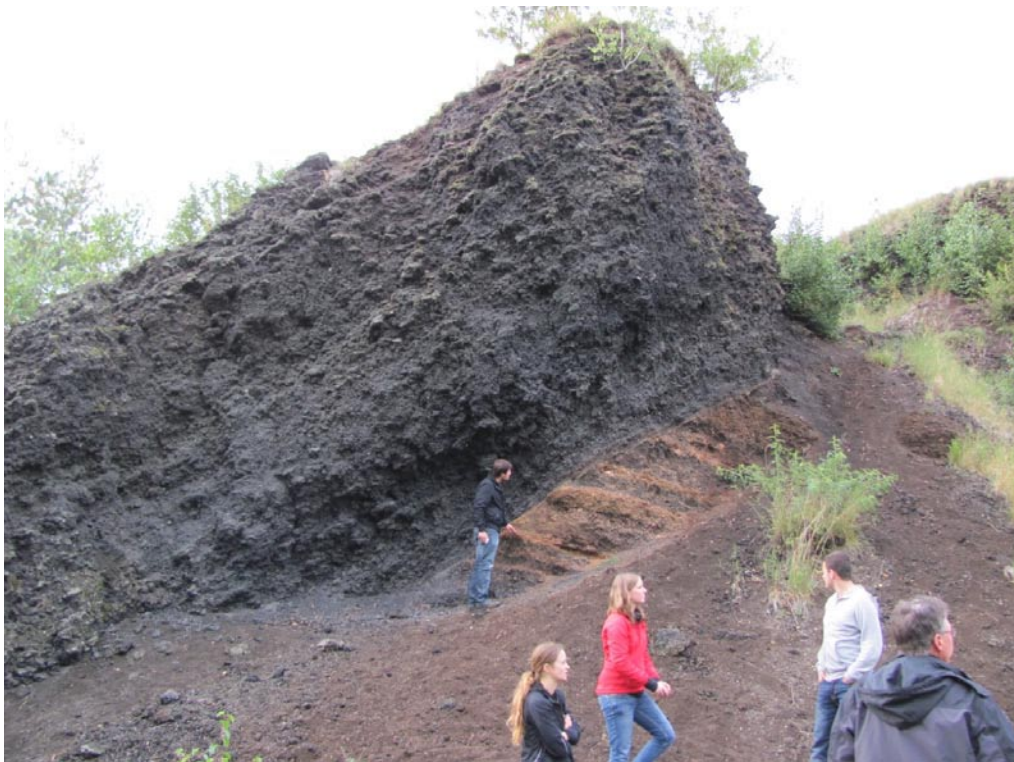
Durch Steinbrucharbeiten wurde der innere Aufbau des Eisenbühl zugänglich. Die jüngeren schwarzen Schlacken fallen nach links zum Kraterzentrum hin ein. Die älteren, z.T deutlich braunen Schichten fallen hingegen nach rechts ein. Hierbei handelt es sich um die Produkte einer initialen phreatomagmatischen Aktivitätsphase. Die Schichten weisen daher nicht nur vulkanische Bestandteile, sondern auch hohe Anteile an Nebengesteins-Fragmenten auf.