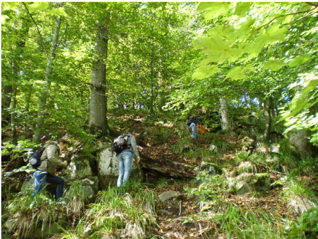
In der Kernzone des Biosphärenreservats Rhön; Anstieg zum Schafstein-Gipfel