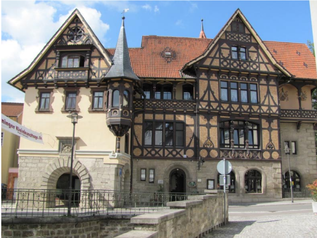
Impressionen aus Meiningen