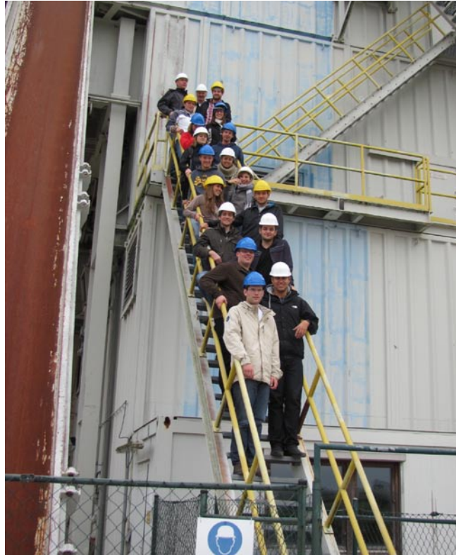
Die komplette Exkursionsgruppe nach der erfolgreichen Besteigung des Bohrturms.