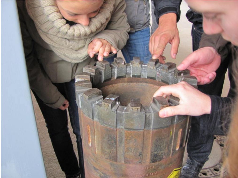
Begutachtung eines Bohrkopfes für Kernbohrungen