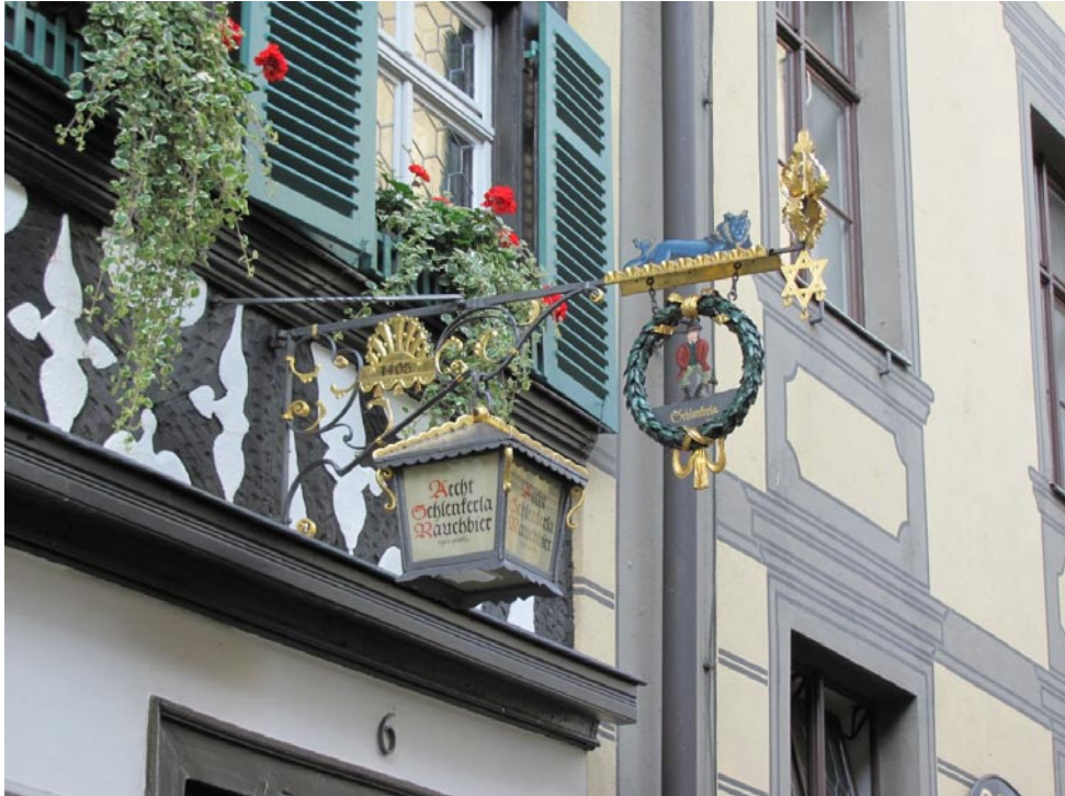
Die berühmte Rauchbier-Wirtschaft „Schlenkerla“ in der Bamberger Altstadt mit dem alten Zunftzeichen der Bierbrauer.