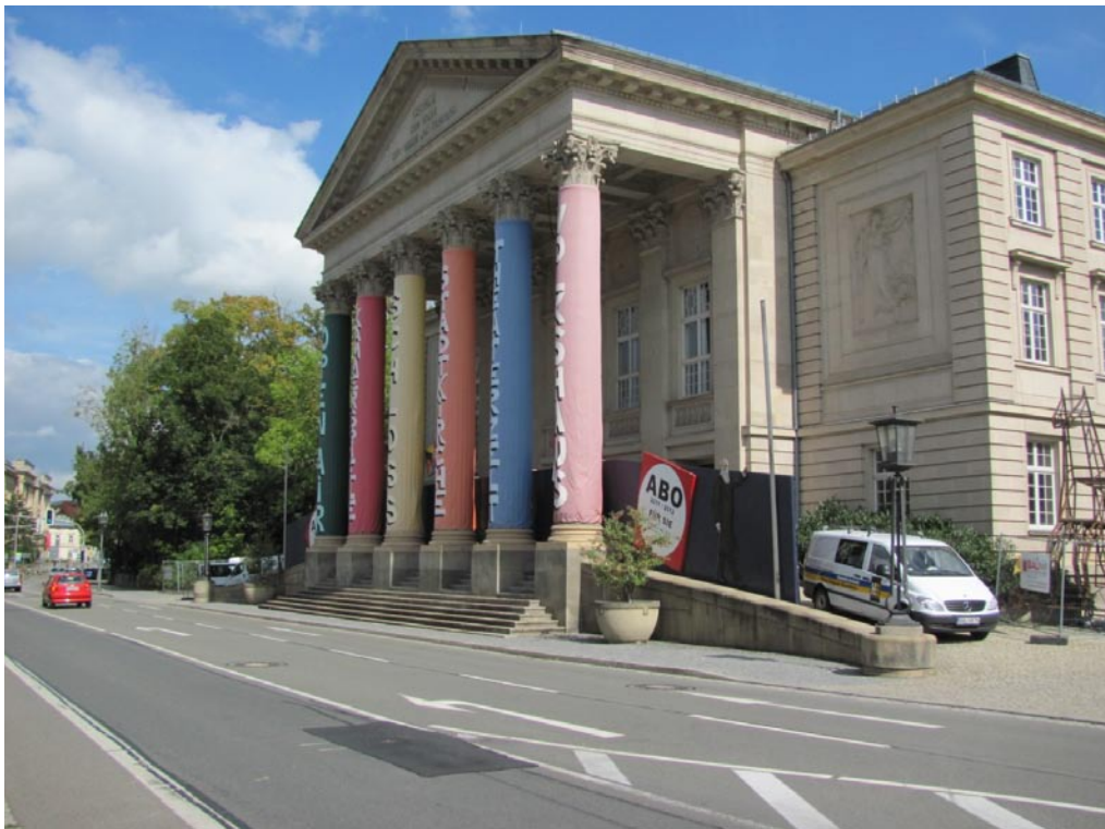
Impressionen aus Meiningen – Das Meininger Theater (Südthüringisches Staatstheater)