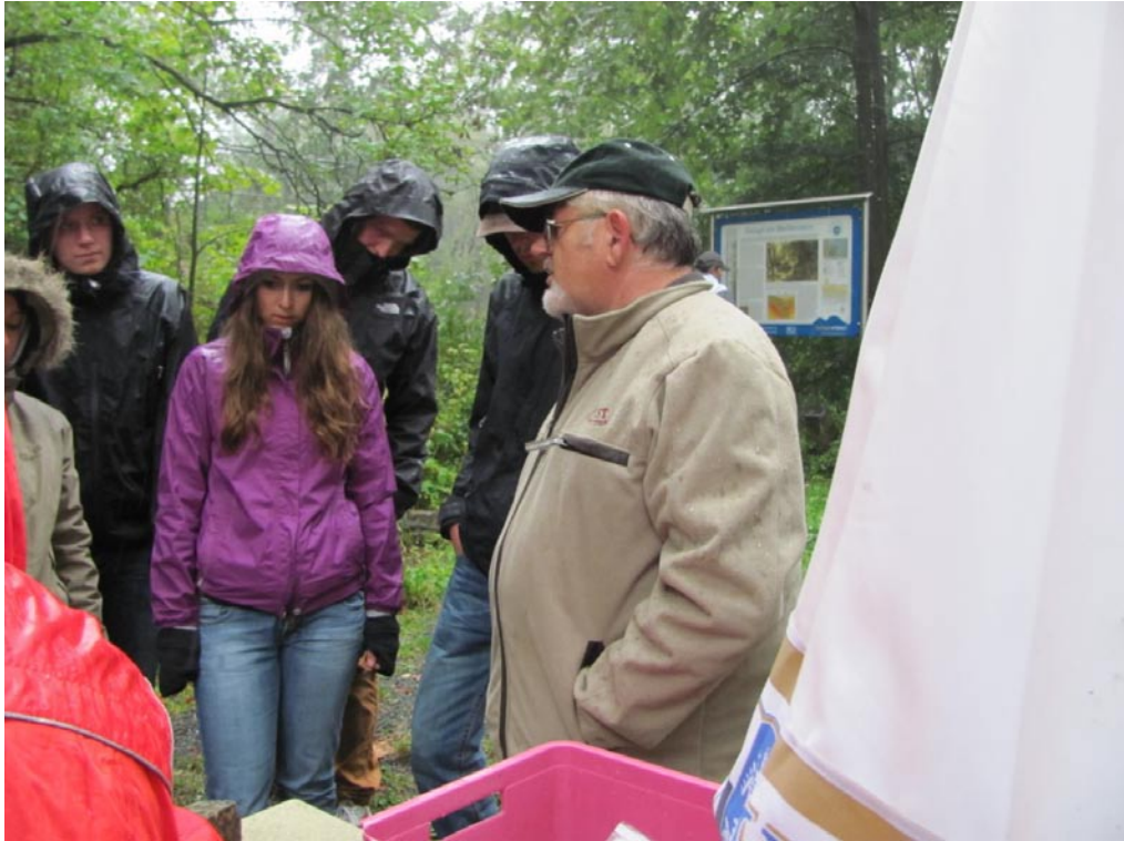
Die Exkursionsgruppe am Weißenstein nahe Stammbach, am Tag des Geotops 18.09.2011.