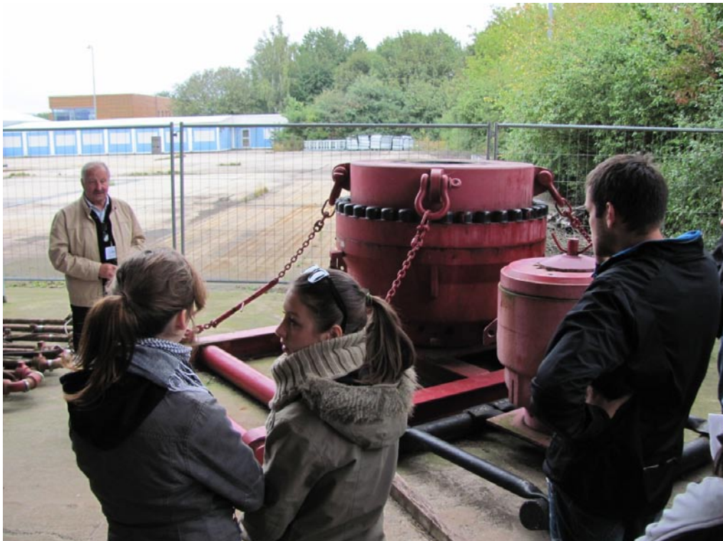
Die Studierenden an einem „Blow-out Preventer“, der auch bei Erdöl-Bohrungen tunlichst immer vorhanden sein sollte.