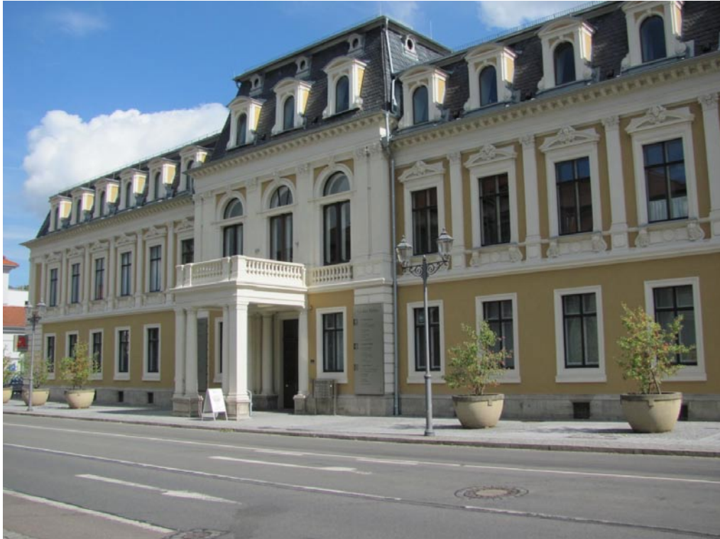
Impressionen aus Meiningen – Das Große Palais (Erbprinzliche Palais)