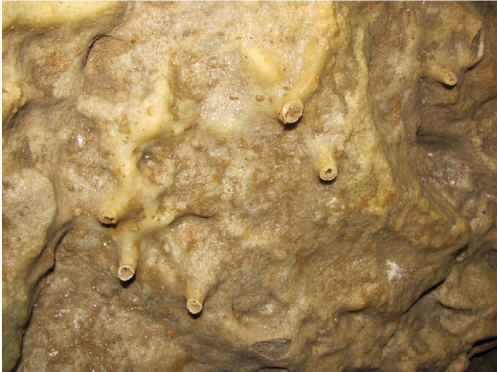
Teufelhöhle bei Pottenstein; Detailaufnahme der Höhlendecke mit Deckensinter und einigen Stalagtiten. Man erkennt, dass die Stalagtiten in einem frühen Bildungsstadium als Sinterröhrchen (Makkaroni-Stalaktiten) vorlagen.