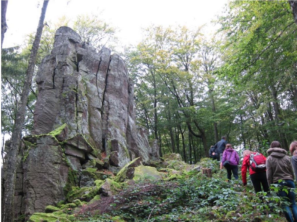
Aufstieg zur „Steinwand“ in der Kuppenrhön, zwischen Kleinsassen und Poppenhausen.