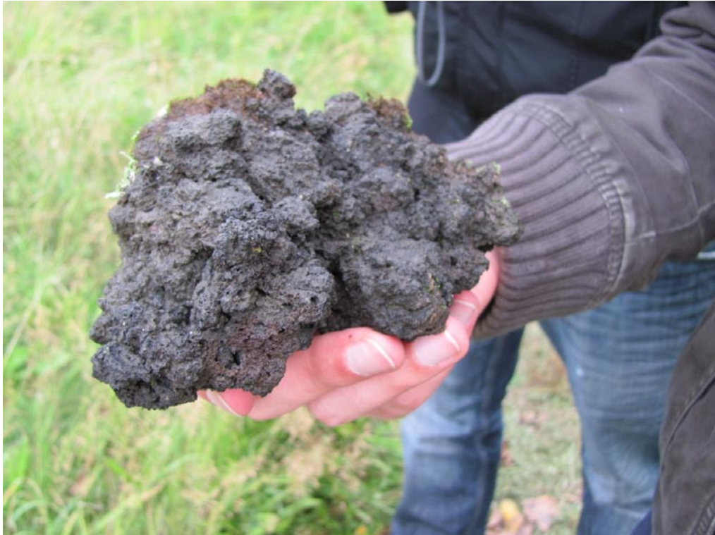
Dunkle, leicht verschweißte Schlacke aus der jüngeren, strombolianischen Eruptionsphase des Eisenbühl.