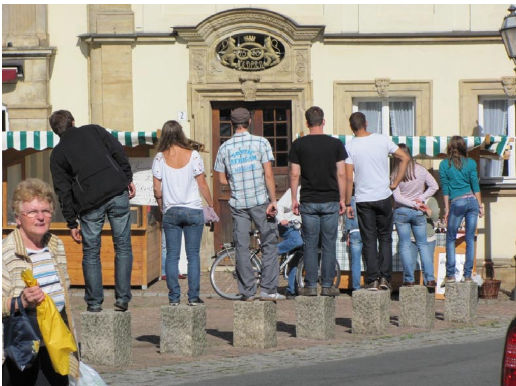
ein Teil der Exkursionsgruppe bei der Begutachtung des Wochenmarktes in Ebern