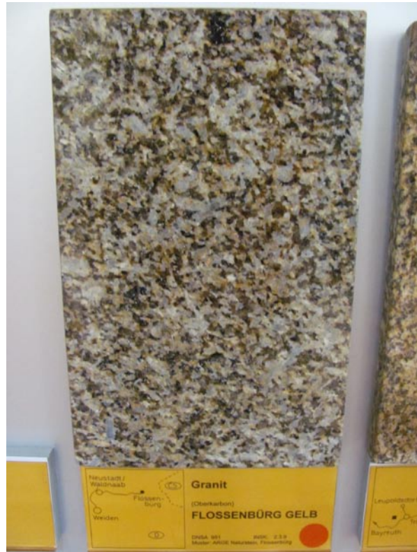
Polierte Musterplatte des Flossenbürger Granits (Oberpfalz) in der Gesteinssammlung des Deutschen Natursteinarchivs in Wunsiedel. Die Probe stammt vom Flossenbürger Schloßberg.