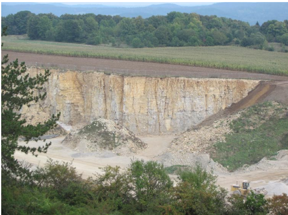
Blick vom Aussichtsturm auf der Hohenmirsberger Platte (nahe Pottenstein) in einen aktiven Steinbruch, in dem Malmkalke abgebaut werden. Die hier aufgeschlossenen Kalkabfolgen zeichnen sich durch sehr gute, horizontale Bankung und senkrecht dazu verlaufende Klüfte aus. Entlang der vertikalen Klüfte kann Oberflächenwasser gut in tiefere Gesteinsschichten eindringen und dort zur Verkarstung beitragen. Weiterhin bemerkenswert ist die nur sehr geringmächtige Bodenbildung auf einer dünnen Lage aus feinscherbigem periglazialen Verwitterungsschutt.