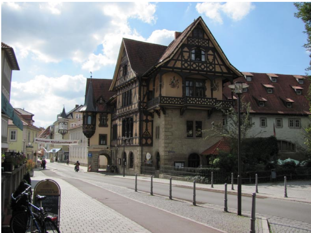
Impressionen aus Meiningen – Das Henneberger Haus