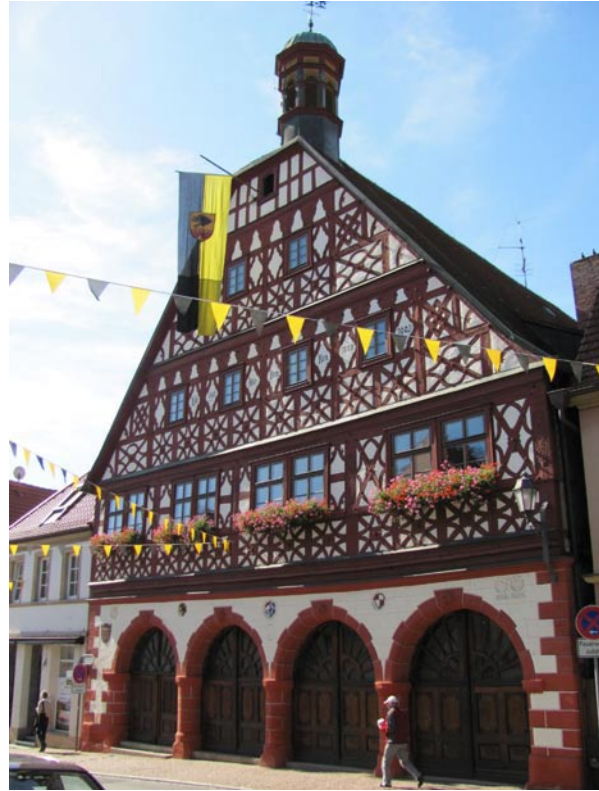
Das Rathaus von Ebern – ein imposanter Fachwerkbau