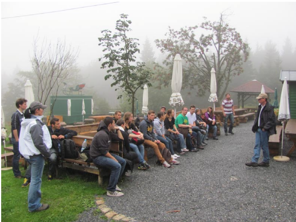
Die Exkursionsgruppe im Fichtelgebirge: kurzer Rast am Seehaus auf dem Weg zum Nußhardt, dem mit 972 m üNN dritthöchsten Berg im Fichtelgebirge.