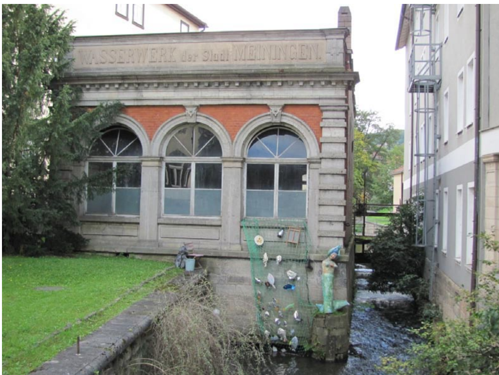
Meiningen, die kleine Stadt im Werratal zwischen Thüringer Wald und Rhön, kann als ehemalige Residenz der Herzöge von Sachsen-Meiningen auf eine bemerkenswerte Kulturgeschichte zurückblicken. Bei einem Spaziergang durch die historische Altstadt wird dies an vielen Stellen augenfällig.