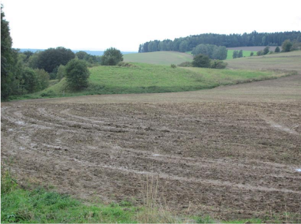
Blick von der deutsch-tschechischen Grenze bei Neualbenreuth auf den jungquartären Vulkan Zelezná hora (Eisenbühl), Blick nach W.