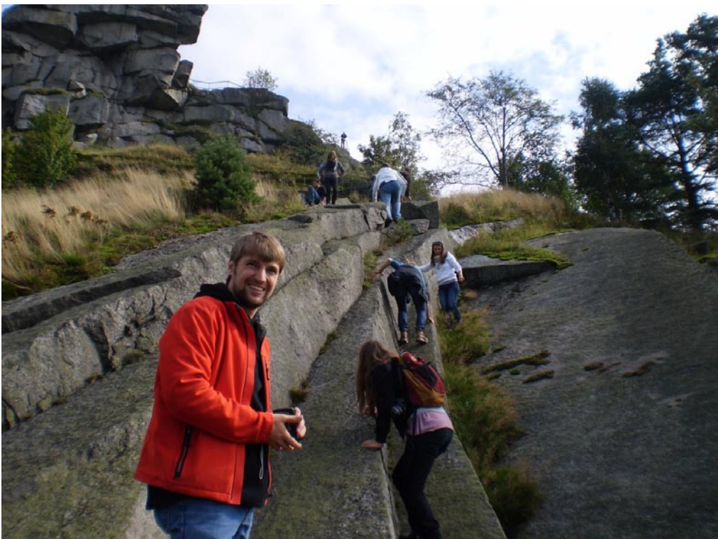
Aufstieg zum Flossenbürg-Gipfel