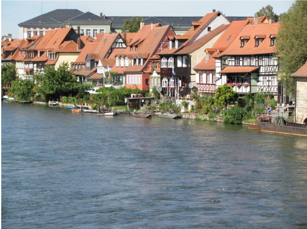
„Klein-Venedig“ – eine weitere Facette des historischen Bamberg