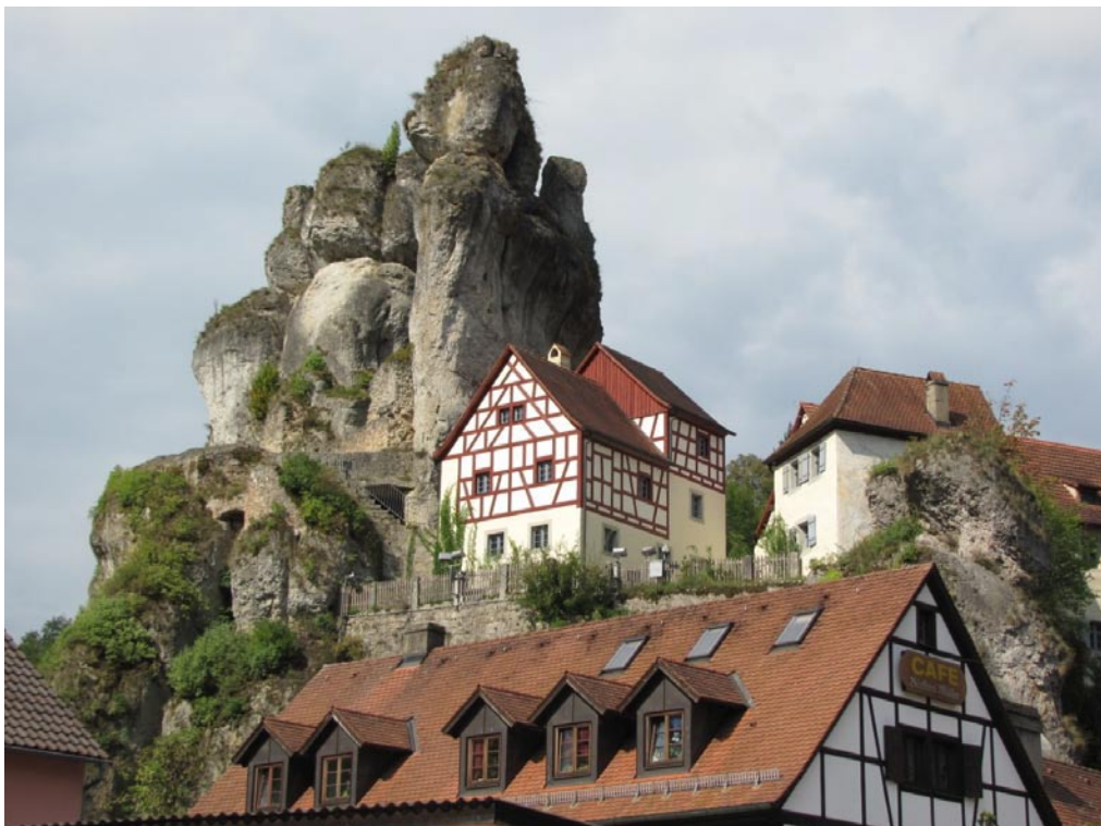
Beispiel für den kreidezeitlichen Kegelkarst in Tüchersfeld, wahrscheinlich das am häufigsten abgelichtete Motiv der Fränkischen Schweiz.