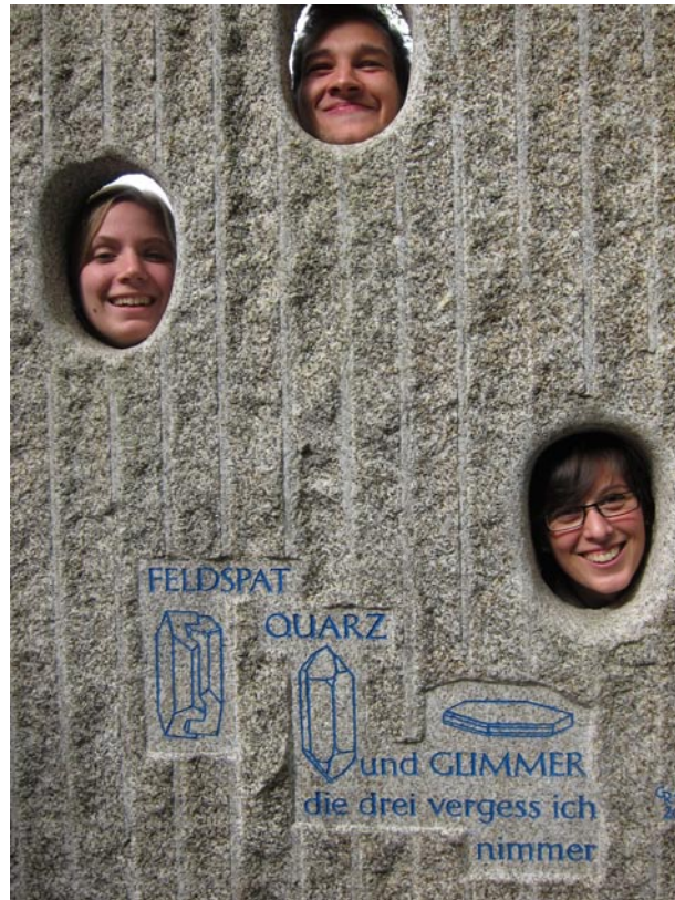
..und gleich noch mal...