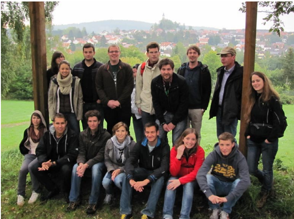
Die Exkursionsgruppe vor der Silhouette von Pleystein.

Blick aus östlicher Richtung auf unseren Quartierstandort Pleystein i.d. Oberpfalz. Wahrzeichen der Stadt ist die im Barockstil erbaute Wallfahrtskirche (Kreuzbergkirche) auf dem sog. Rosenquarzfelsen. Hierbei handelt es sich um den harten Quarzkern eines spätpaläozoischen Pegmatitstocks, der als verwitterungsresistentes Material erosiv herauspräpariert wurde und heute als markante Felskuppe die kleine Stadt Pleystein um etwa 30 m überragt. Die senkrecht abfallenden Wände unterhalb der Kirche sind auf den Abbau des Quarzes als Rohstoff für die Glas- und Porzellanherstellung zurückzuführen, der von 1851 bis 1920 hier umging.