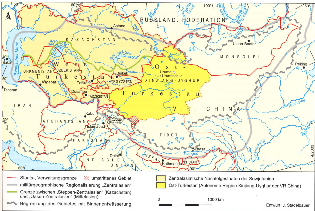
Fig. 1 Raumgliederungen Innerasiens

Nachfolgestaaten der Sowjetunion fügt eine weitere Nuance geopolitischer Aspekte hinzu.